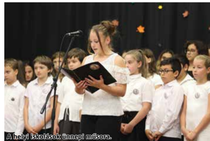
A helyi iskolások ünnepi műsora.