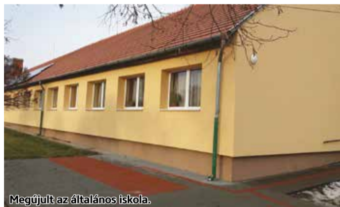
Megújult az általános iskola.