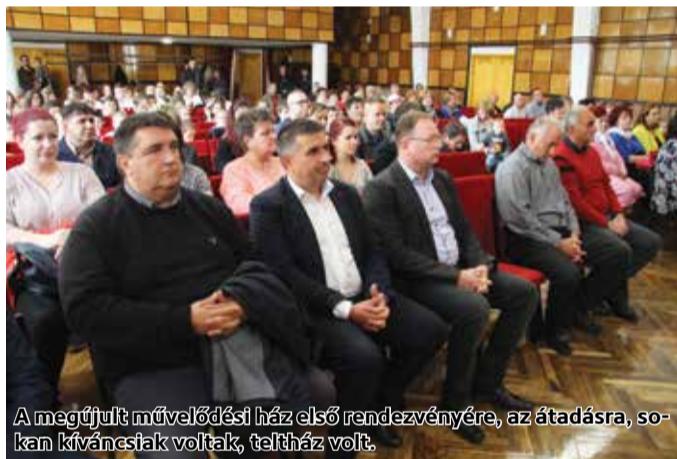
A megújult művelődési ház első rendezvényére, az átadásra, sokan kíváncsiak voltak, teltház volt.

A Május 1. Művelődési Ház hőszigetelésére, nyílászáró cseréjére, és fűtéskorszerűsítésére összpontosító pályázat a megye számára rendelkezésre álló települési fejlesztési program forrásából valósult meg. A mögöttünk hagyott nyár folyamán elvégezték a homlokzati falak és a lapostető hőszigetelését, illetve kicserélték a gázkazánt és a nyílászárókat is. Ezeken túl kifestették a belső helyiségeket, ahol szükséges volt, ott