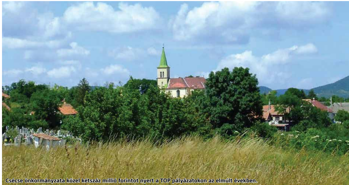
Csécsé önkormányzata közel kétszáz millió forintot nyert a TOP pályázatokon az elmúlt években.

A pályázati támogatásoknak köszönhetően az elmúlt években számos beruházás valósult meg Csécsén. A településen folyamatosan zajlanak beruházások.