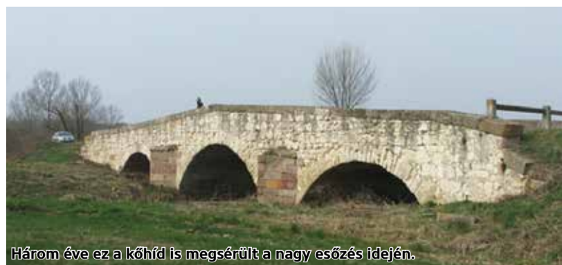
Három éve ez a kőhíd is megsérült a nagy esőzés idején.

Héhalom községben a nagyobb esőzések alkalmával többször okozott jelentős kárt az utóbbi években a környező dombokról lefolyó csapadékvíz. A falu önkormányzata évek óta kereste a megoldást a vízkár kockázatok kivédésére, majd 2016-ban pályázatot nyújtott be a Terület- és Településfejlesztési Operatív Program keretében belterületi vízrendezésre. A rekonstrukció célja a belterületi csapadékvíz elvezető rendszer fejlesztése volt.