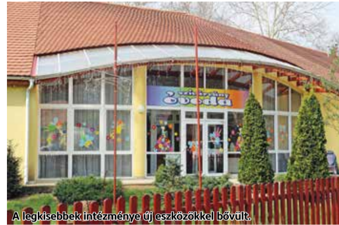
A legkisebbek intézménye új eszközökkel bővült.

Tóth Gabriella a jövőre nézve elmondta: – Elképzeléseim között szerepel a helyi civil közösségi élet fejlesztése, to-