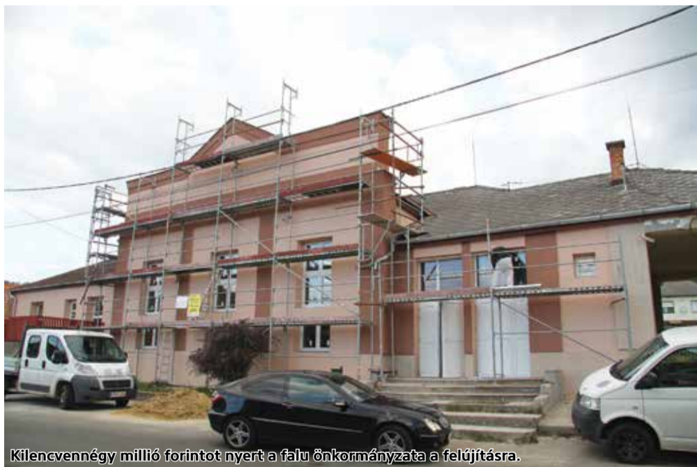
Kilencvennégy millió forintot nyert a falu önkormányzata a felújításra.

Mátraszelén folyamatban van a művelődési ház épületének felújítása. A Község Önkormányzata sikeres pályázatot nyújtott be, a Terület- és Településfejlesztési Operatív Programon nyert támogatásból valósítja meg a fejlesztést.