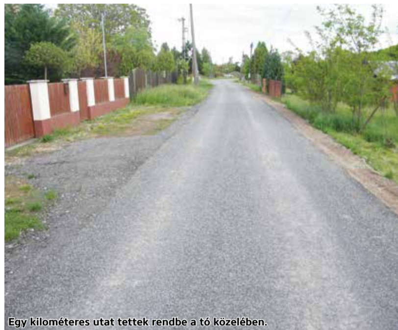
Egy kilométeres utat tettek rendbe a tó közelében.