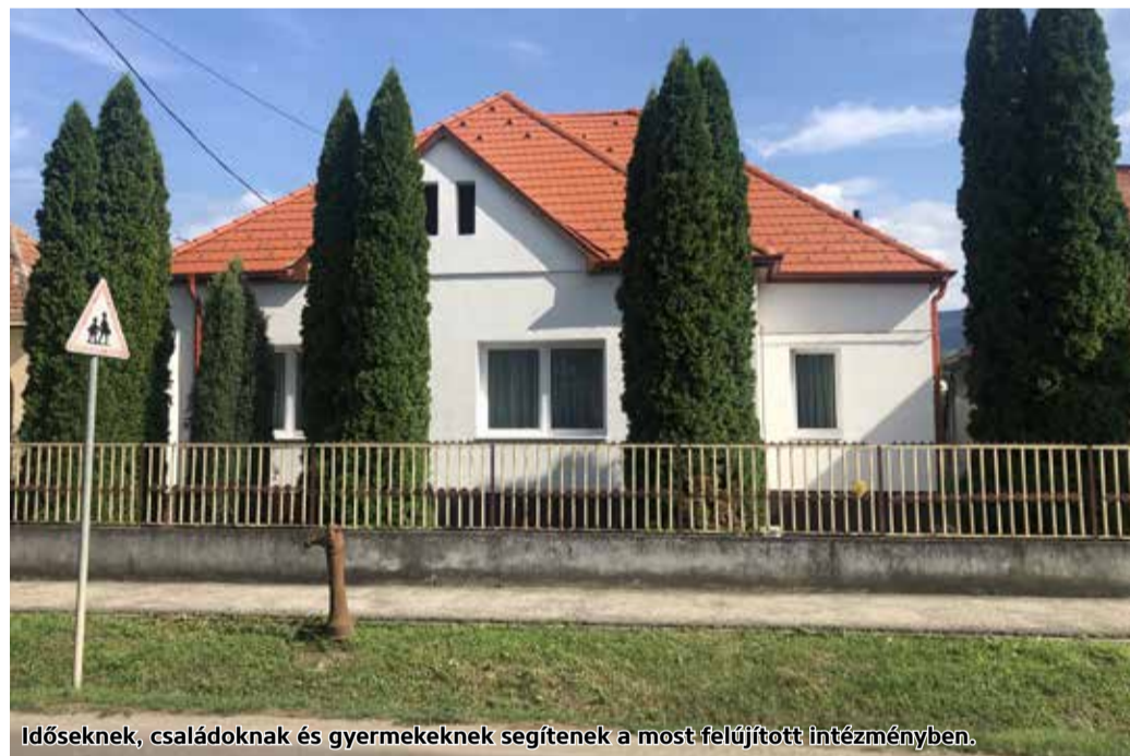
Időseknek, családoknak és gyermekeknek segítenek a most felújított intézményben.

Tar Község Önkormányzata sikeres pályázatot nyújtott be a Terület- és Településfejlesztési Operatív Program keretében azzal a céllal, hogy a szolgáltatások színvonalának növelés érdekében fejlessze a szociális ellátás infrastruktúráját.