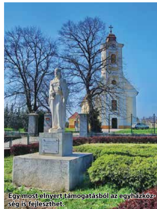
Egy most elnyert támogatásból az egyházközség is fejleszthet.

Palotásan az egyházközség is fejleszthet. A Miniszterelnökség a közelmúltban tette közzé a Magyar Falu Program újabb pályázatának eredményét. Nógrád megyében 21 egyházközség kapott közösségi tereinek fejlesztésére támogatást. Palotás is a nyertesek között van. Ezt Gyopáros Alpár, a modern települések fejlesztéséért felelős kormánybiztos jelentette be. A helyi egyházi közösségi terek fejlesztése című projekt 7 milliárdos kerete teljes egészében kimerült, 487 nyertes jelentkezéssel – áll a miniszterelnökség által kiadott közleményben.