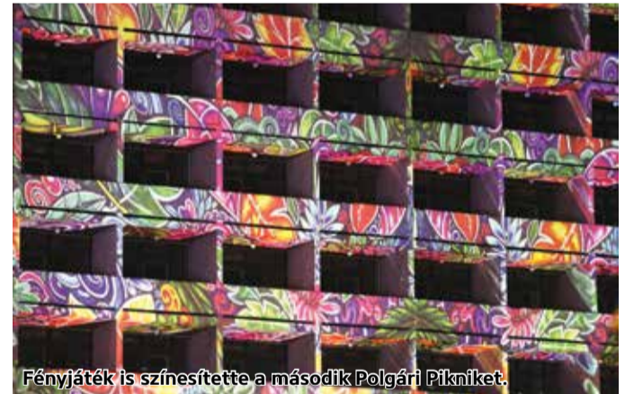
Fényjáték is színesítette a második Polgári Pikniket.