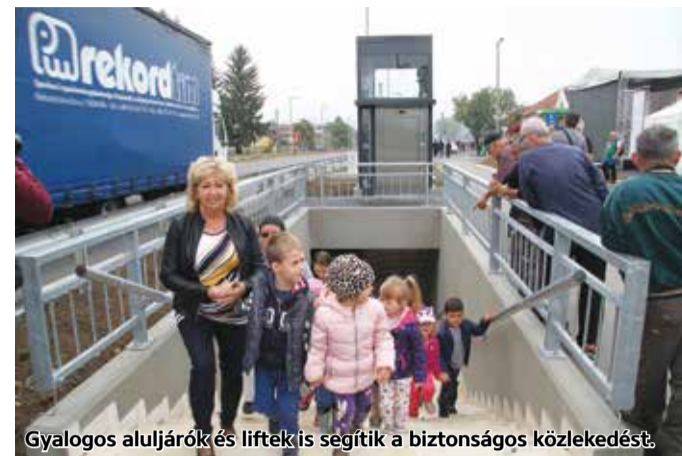
Gyalogos aluljárók és liftek is segítik a biztonságos közlekedést.