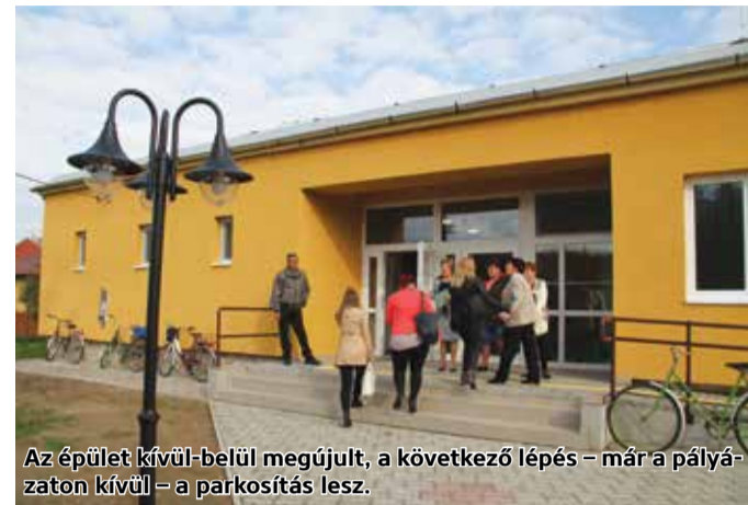
Az épület kívül-belül megújult, a következő lépés – már a pályázaton kívül – a parkosítás lesz.

kicserélték a burkolatokat, felújították a parkettát, kicserélték a beltéri ajtókat. Megújult a teljes villamoshálózat, új lámpákat és kapcsolókat, konnektorokat szereltek fel. A fejlesztés megvalósításához az önkormányzat 92.405.951 Ft vissza nem térítendő támogatást nyert el 100%-os támogatási intenzitás mellett a TOP-3.2.1-16-NG1-2017-00064 azonosító számú pályázat keretében. A teljes belső felújításhoz az önkormányzat önerőből is biztosított anyagi forrást, mivel a pályázati támogatás célzottan, az energetikai fejlesztésre volt fordítható. A beruházás ünnepélyes átadóján nagyon sokan vettek részt. A megyei vezetés részéről Becsó Zsolt és dr. Becsó Károly országgyűlési képviselők és Skuczai Nándor megyei közgyűlési elnök is jelen volt. Dr. Becsó Károly köszöntőjében elmondta: azt kívánja a mátranovákiaiaknak, hogy legyen ez a hely az identitás és a kultúra szentélye. – Polgármester asszony és csapata nagyon szép művet alkotott! Biztatom Önöket a folytatásra, támogassák őket az október 13-i választásokon, hogy 14-étől tovább folytathassuk a közös munkát – fogalmazott. Skuczai Nándor, a Nógrád Megyei Önkormányzat Közgyűlésének elnöke ünnepnek nevezte az átadást. Megköszönte mindenkinek, aki munkájával hozzájárult a művelődési ház felújításához. Emlékeztetve a jelenlévőket a többi, elmúlt években elvégzett beruházásokra is