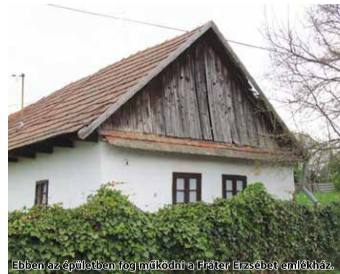
Ebben az épületben fog működni a Fráter Erzsébet emlékház.

Egy nagy beruházás is folyik jelenleg a településen: 960 millió forintból épül ki a szennyvízelvezető rendszer. 28 millió forintból készült el a csapadékvíz-elvezető rendszer. Közel 36 millió forintból kerül kialakításra majd a faluház. Ezekon túl rendezvények szervezésére is nyert támogatást a település, közel 4 millió forintot.