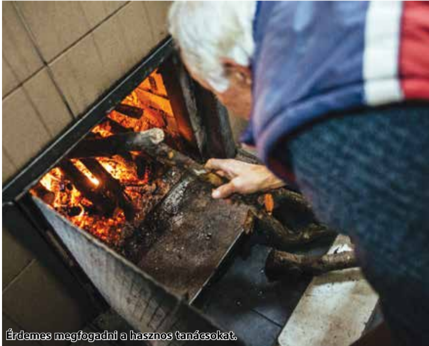
Érdeemes megfogadni a hasznos tanácsokat.

A közleményben kitérnek arra: a statisztikák azt mutatják, hogy a fűtési időszakban duplájára emelkedik a lakástüzek száma; ezek megelőzése érdekében a családi házak esetében szükséges a kémények ingyenes ellenőrzésének megrendelése, résszellőzők beszerelése a szigetelt ajtóba és ablakokba, továbbá a szén-monoxid-érzékelők felszerelése.