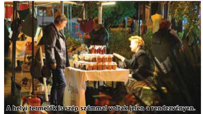
A helyi termelők is szép számmal voltak jelen a rendezvényen.