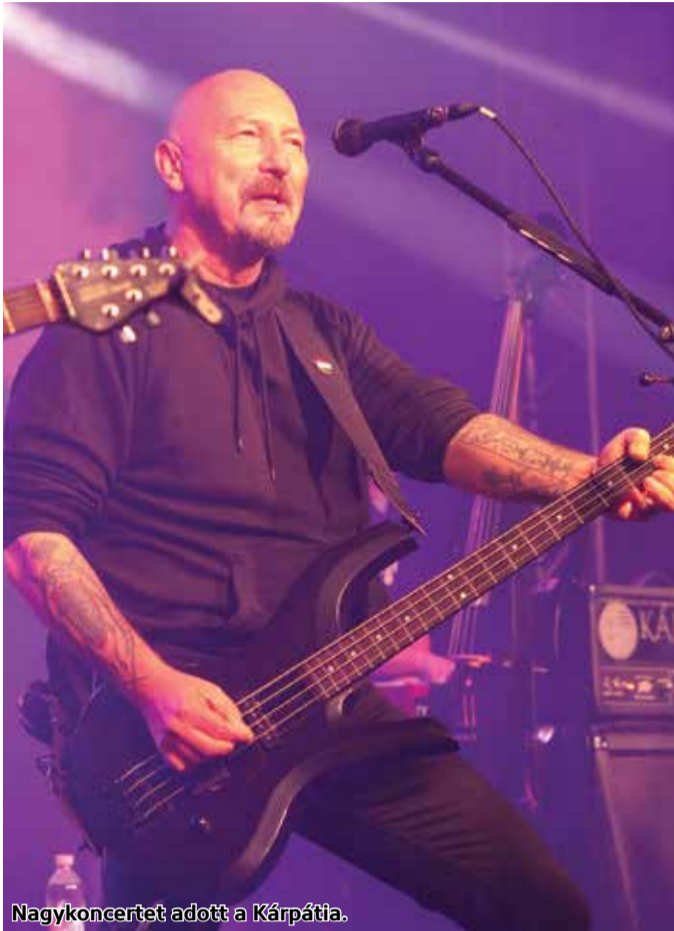
Nagykoncertet adott a Kárpátia.

Második alkalommal került megrendezésre a színes esemény a megyeszékhelyen, melyen most is rengetegen vettek részt. A Concrete Média által kiemelten támogatott Gasztro Polgári Pikniken a környékbeli gasztronómiai fesztiválok csapatainak finom ételei mellett számos zenei program, kézműves sétány és vidámpark várta a látogatókat. A sztárfellépő a Kárpátia zenekar volt.