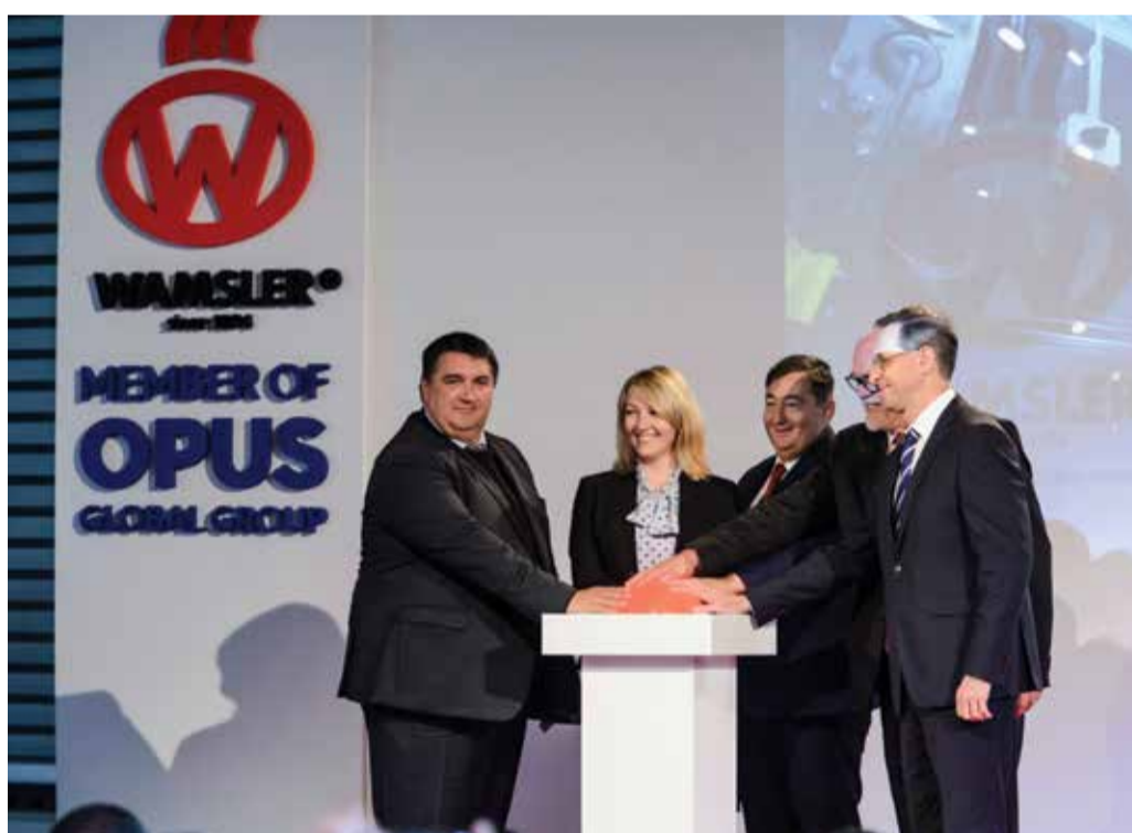
Becsó Zsolt fideszes országgyűlési képviselő, Mészáros Beatrix, a tulajdonos Opus Global Nyrt. igazgatótanácsának elnöke, Mészáros Lőrinc, az Opus Global Nyrt. többségi tulajdonosa, Finta Ferenc, a Wamsler SE vezérigazgatója és Varga Mihály pénzügyminiszter (b-j) a tűzhelyeket és kandallókat gyártó salgótarjáni cég új üzemcsarnokának avatásán 2019. október 3-án. Az 5400 négyzetméteres robotizált üzemcsarnok 3,6 milliárd forintba került, amit a kormány 1,8 milliárd forinttal segített a nagyvállalati támogatási program részeként.

Ismertette, a nagyvállalati támogatási programban 2015 óta 78 milliárd forint támogatást helyeztek ki, ebből több mint 200 milliárd forint értékű fejlesztés, beruházás valósult meg Magyarországon, és 2400 új munkahely is létrejött. Nincs olyan megye, amelyben ne valósult volna meg ilyen típusú támogatás – tette hozzá. A tárcavezető a magyar gazdaság eredményeit ismertette hangsúlyozta: az elmúlt évek következetes gazdaságpolitikája eredményes volt, a növekedés szerkezete kiegyensúlyozottabbá vált, az államadósság a GDP 70 százaléka alá csökkent, miközben az államháztartás fenntarthatósága tovább erősödött. A keresetek bővülésével, az adók csökkentésével párhuzamosan emelkedett a munkába állók