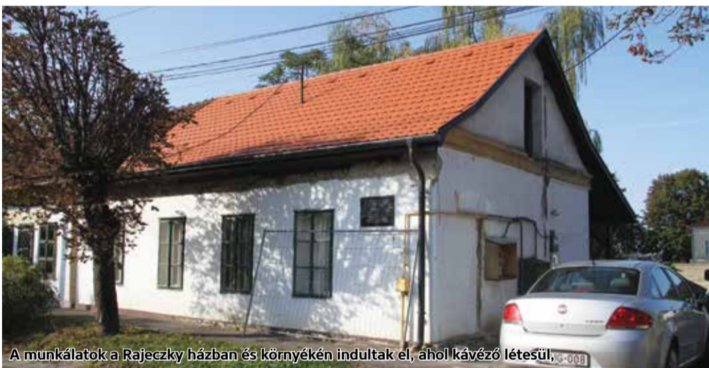
A munkálatok a Rajeczky házban és környékén indultak el, ahol kávézó létesül.

Közel félmilliárd – 498,13 millió – forint vissza nem térítendő támogatásból újul meg Pásztó belvárosában a Romkert és környéke. A kivitelezés az elmúlt hetekben elkezdődött.