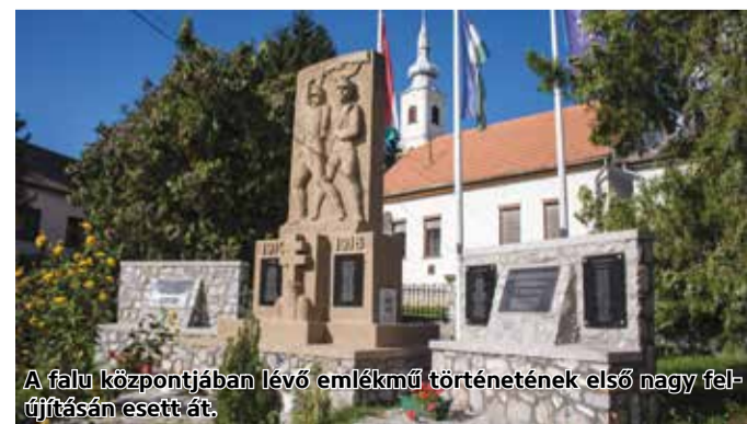
A falu központjában lévő emlékmű történetének első nagy felújításán esett át.

Egymillió forintból újult meg az I. és II. világháború hőseinek emléket állító emlékmű Mátranovákon. A település templomához vezető út mentén található parkban lévő szobrot 1938-39-ben készítette Szabó István szobrászművész. A milicenténárium alkalmából és a II. világháború áldozatainak emlékére két emléktábla került az emlékmű mellé, az elhunytak nevével. Tavaly ősz végén tovább bővült az emlékhely a holokauszt áldozatai előtti tisztelgéssel: a Mátranováról 1944. június 14-én ártatlanul elhurcolt és megölt 25 ember emlékét egy márványtábla őrzi. Ennek kihelyezése egy a településre költözött magánszemélynek köszönhető.