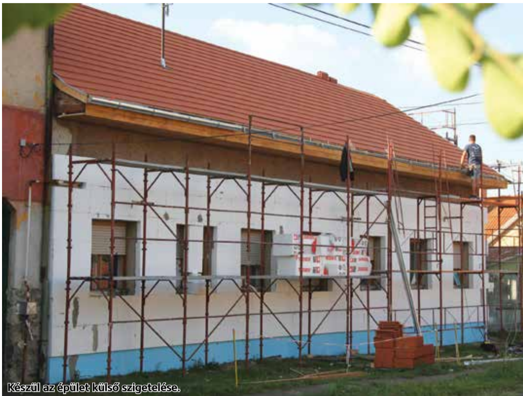
Készül az épület külső szigetelése.