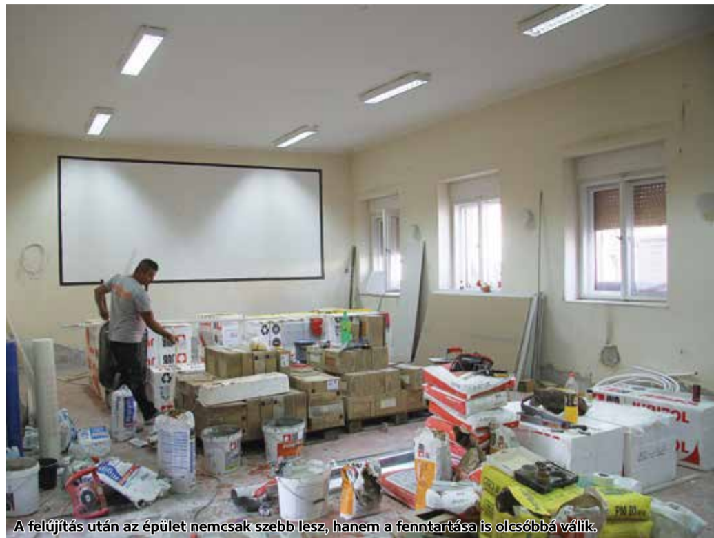
A felújítás után az épület nemcsak szebb lesz, hanem a fenntartása is olcsóbbá válik.

A TOP-3.2.1-16-NG1 – Önkormányzati épületek energetikai korszerűsítése című kiíráson elnyert támogatás felhasználásával korszerűsítik a hasznosi művelődési ház épületét. A 26.809.700 forintos beruházás célja az intézmény energiahatékony és takarékos működtetése. Nyáron kezdődtek el a munkálatok az épületen, ahol elsőként a tetőt kellett lecserélni. Az energetikai korszerűsítés részeként elvégzik a teljes körű akadálymentesítést, kicserélik a nyílászárókat, felújítják a meglévő vizesblokkokat, szigetelést kap a külső falak homlokzata és a padlásfödém. A beruházás során a fűtésrendszert kondenzációs kazán beépítésével és napelemekkel korszerűsítik.