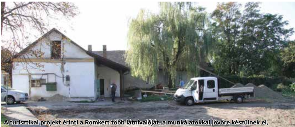
A turisztikai projekt érinti a Romkert több látóival, a munkálatokkal jövőre készülnek el.

Megújul a középkori malom, mellette nyílt közösségi tér jön létre szabadtéri színpaddal, mozival, fogadóépülettel. A Pásztói Múzeum interaktív bemutatói formákkal gazdagodik. Rajeczky Benjamin ciszterci szerzetes lakóháza is megújul, szomszédjában kávézó nyílik. Az oskolamester házában legendáját ifjúsági regény és kosztümös szerepjáték formájában dolgozzák fel. A Pásztói Múzeum látóival is felfrissülnek, izgalmas öslényntani leletegyüttes bemutatásával. A projekt befejezése 2020 nyaráig várható.