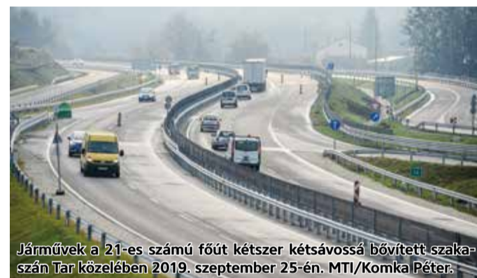
Járművek a 21-es számú főút kétszer kétsávosá bővített szakaszán Tar közelében 2019. szeptember 25-én.