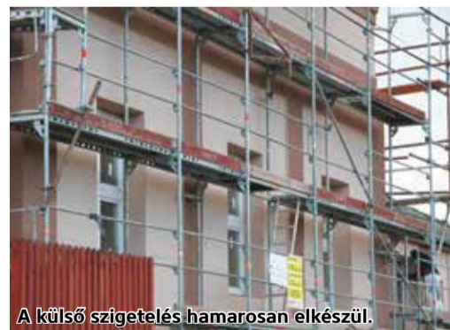
A külső szigetelés hamarosan elkészül.

A fejlesztés során energetikai korszerűsítést valósítanak meg, a cél csökkenteni a fenntartási költségeket és a károsanyagkibocsátást. Már megtörtént a nyílászárók cseréje és a napokban elkészül az épület külső oldali hőszigetelése is. A fűtésrendszer is megújul: a korszerűtlen, légbefúvós gázkazánt automatikával programozható fűtésszabályozással ellátott kondenzációs kombi gázkazánra cserélik, valamint a teljesítmény és a hőigény pontatlansága miatti veszteségek csökkentése érdekében termosztatikus radiátorszelepeket szerelnek be. Az épület villamos energia fogyasztásának csökkentése/kiváltása érdekében hálózatra visszatápláló napelemes rendszert telepítenek. A fejlesztés megvalósításához Mátraszele Község Önkormányzata 93 938 010 Ft vissza nem térítendő támogatást nyert el 100%-os támogatási intenzitás mellett a TOP-3.2.1-16-NG1-2017-00073 azonosító számú pályázat keretében.