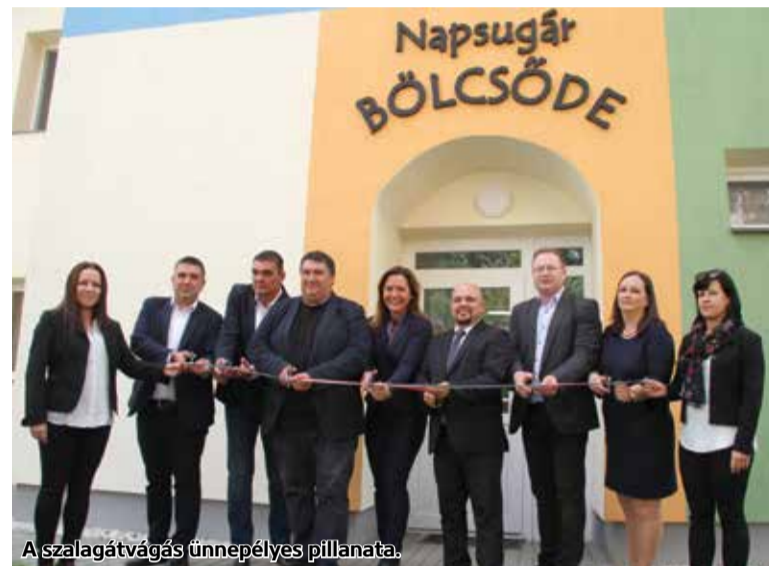
A szalagátvágás ünnepélyes pillanata.

Felújított bölcsődét adták át október 4-én a Nógrád megyei Bátorterenyén, a fejlesztés közel 150 millió forintból készült el. Az Emberi Erőforrások Minisztériumának európai uniós fejlesztéspolitikáért felelős államtitkára az átadónapságon úgy fogalmazott, egy város vezetői a közösség jövőjének építésén dolgoznak, amikor bölcsődék bővítését és megújítását tervezik.