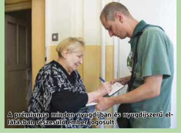
A prémiumra minden nyugdíjban és nyugdíjszerű ellátásban részesülő ember jogosult.

Novemberben a nyugdíjasok a rendszeres havi nyugdíjukkal együtt megkapják az egyszeri – egész évre számolt – nyugdíjkiegészítést is, amelynek összege átlagosan 10 ezer forint lesz – hangsúlyozta.