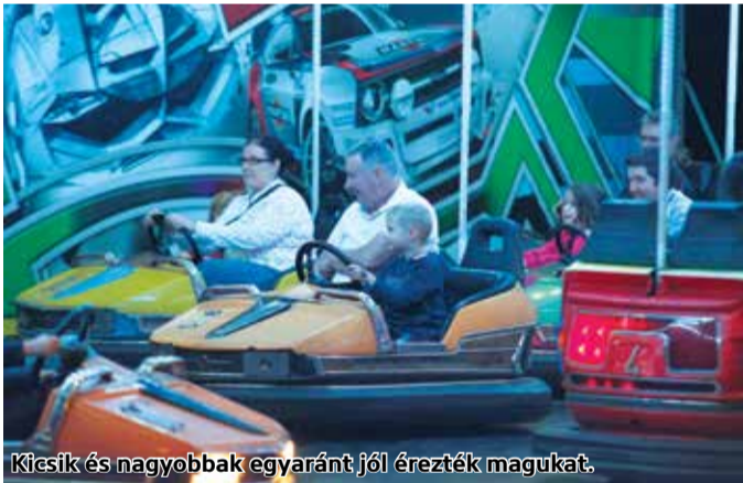
Kicsik és nagyobbak egyaránt jól érezték magukat.