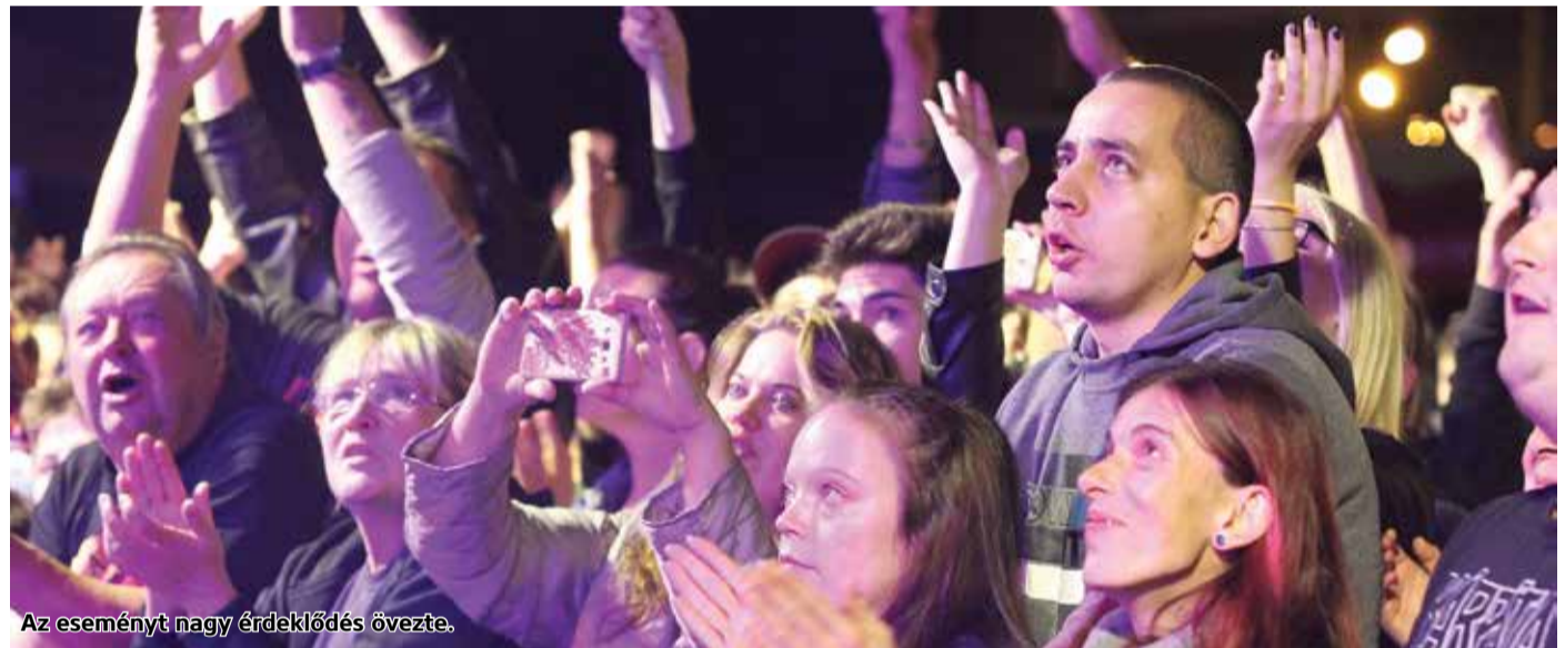
Az eseményt nagy érdeklődés övezte.