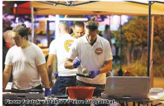
Finom falatok várták a Fő tere látogatókat.