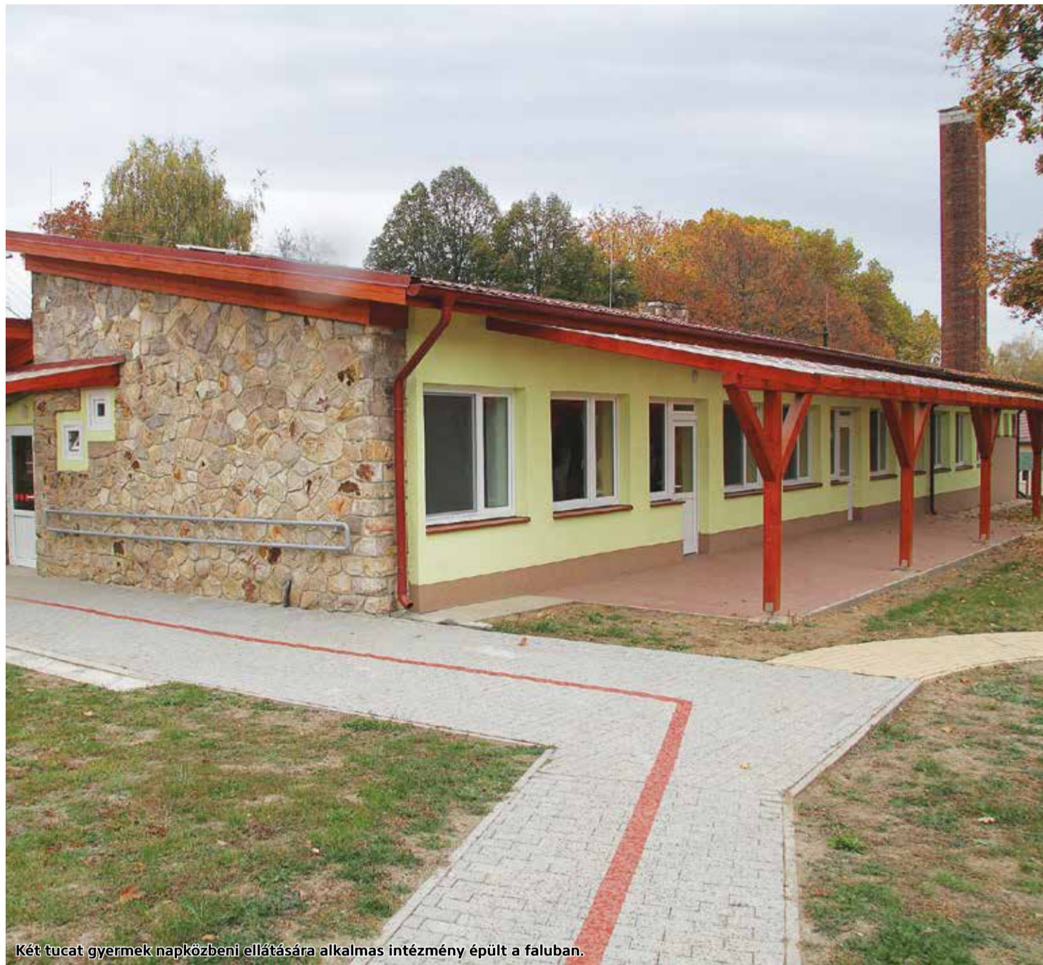
Két tucat gyermek napközbeni ellátására alkalmas intézmény épült a faluban.

Jobbágyi Község Önkormányzata célul tűzte ki, hogy a település szolgáltatási kínálatának bővítésével hozzá kíván járulni a lakosság megtartásához, a foglalkoztatottság növeléséhez. Az Önkormányzat sikeres pályázatot nyújtott be a Terület- és Településfejlesztési Operatív Program keretében azzal a céllal, hogy a tulajdonában lévő ingatlanban bölcsődét létesítsen.