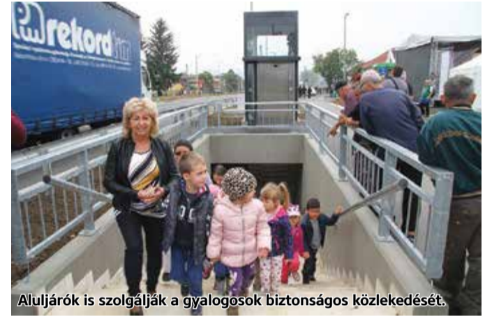
Aluljárók is szolgálják a gyalogosok biztonságos közlekedését.