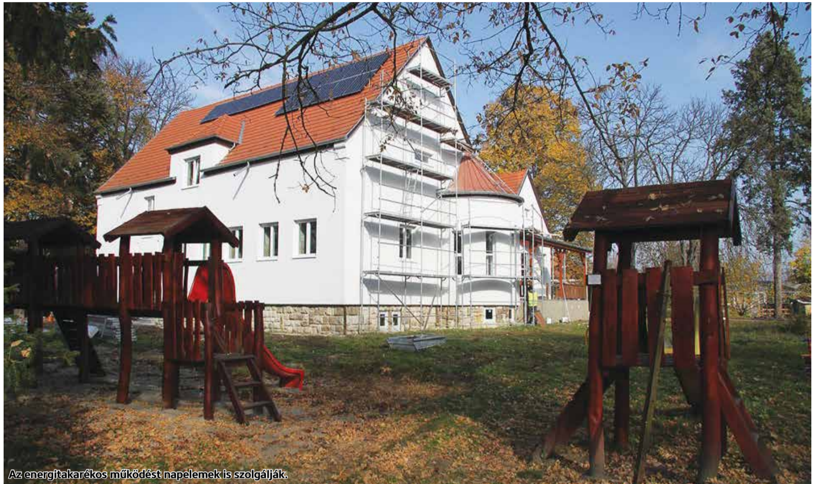
Az energiatakarékos működést napelemek is szolgálják.