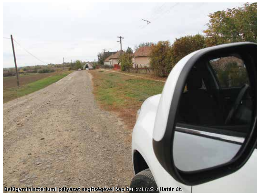
Belügyminisztériumi pályázat segítségével kap burkolatot a Határ út.

Önkormányzati feladatellátást szolgáló fejlesztésekre nyert Palotás község 14,5 millió forintot. Ebből a kormányzati támogatásból a településen két utat érintően fognak korszerűsítéseket elvégezni. A Határ út teljes hosszában, 530 méteren újul meg, valamint a Nefejejs út egy szakaszát is korszerűsítik, 110 méter hosszon.