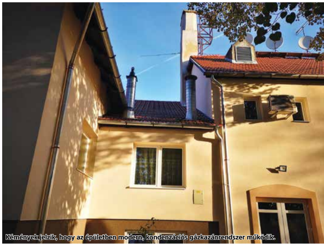
Kémények jelzik, hogy az épületben modern, kondenzációs gázkazánrendszer működik.