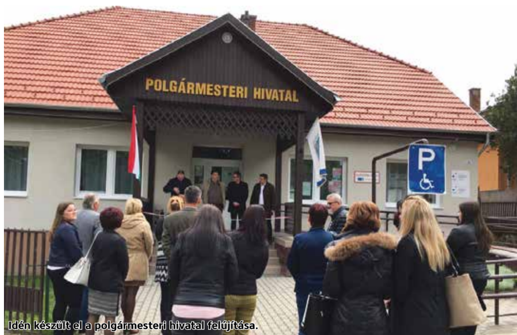
Idén készült el a polgármesteri hivatal felújítása.