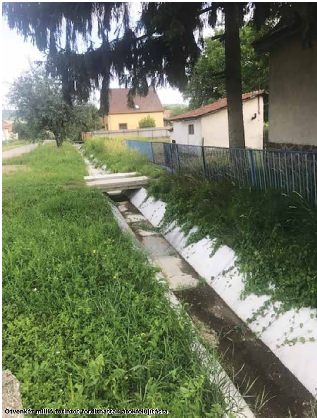
Ötvenkét millió forintot fordíthattak árokfelújításra.

Több sikeres pályázat jóvoltából Mátraverebélyben megújult az árokrendszer jelentős része, zajlik a család- és gyermekjóléti szolgálat felújítása, a település egykori szegényfoltjának helyére pedig kormányzati támogatással egy 21. századi közösségi teret létesítettek.