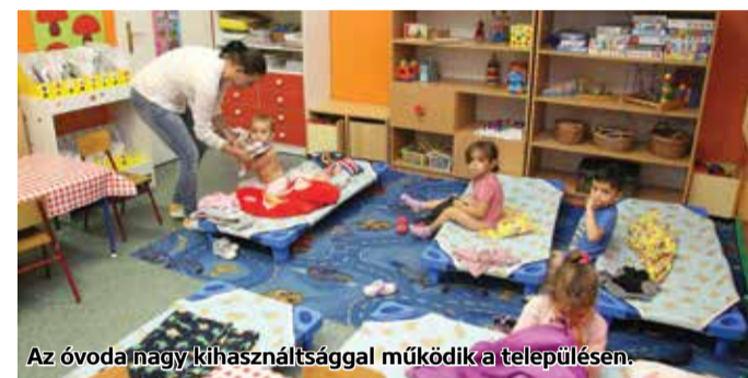
Az óvoda nagy kihasználtsággal működik a településen.

A korszerűsítés célja, hogy az Óvoda épületének energetikai felújítása a jövőben költséghatékony fenntartást biztosítson. A modernizálással csökken az épület és rajta keresztül a település primerenergia igénye, növekszik az energiaellátásban a megújuló energia részaránya, ebből adódóan pedig az épület károsanyag-kibocsátása és energiaköltségei csökkennek. Az 1950-es években épült Tari Örökzöld Óvoda épülete elavult, külső hőszigetelést nem kapott, energetikai jellemzői elmaradtak, emiatt a fenntartása drága, sok károsanyagot bocsát a környezetbe. Jelenleg egy vegyes tüzelésű kazán van az épületben, ezt a korszerűsítés során lecserélik egy faelgázosító kazánra. Megvalósul továbbá automatikával programozható fűtésszabályozás kiépítése is. A teljesítmény és a hőigény pontatlansága miatti veszteségek csökkentése érdekében termosztatikus radiátorszelepek kerülnek beszerelésre. Megtörténik az épület utólagos külső oldali hőszigetelése, a nyílászárók cseréje, az épület akadálymentesítése, valamint a villamos energia fogyasztás csökkentése érdekében napelemes rendszer telepítése is.