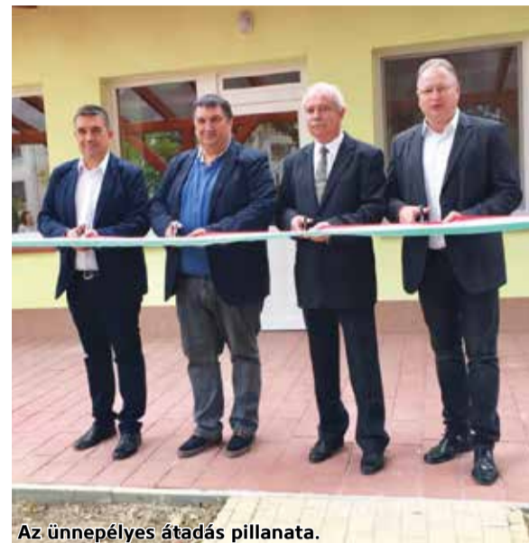
Az ünnepélyes átadás pillanata.

A projekt célja volt, hogy egy kétszobos, modern bölcsődei intézmény jöjjön létre. Az új intézmény 24 gyermek befogadására, nevelésére lesz alkalmas. A projekt helyszínére a választás éppen azért esett, mert korábban is bölcsődei tevékenység folyt benne. Lakóövezetben, csendes, nyugodt helyen található, gépkocsival is könnyű és biztonságos megközelíteni. A tervezett bölcsőde az épület felújításával és belső átalakítással jött létre, egy gondozási egységből, ezen belül kettő – 12 férőhelyes – csoportszobából áll. A bejáratnál található helyiségek funkciója változatlan maradt, a fürdető helyiségből nyílik egy új közlekedő, amelyre felfűzésre került az ágyneműtároló, a mosókonyha-vasaló helyiség, valamint az akadálymentes WC is. Az épület belső infrastruktúrája teljes mértékben felújításra került. Lecserélték a tetőfedést, az épület homlokzata új nyílászárókat és hőszigetelést kapott. Az eszközbeszerzés tárgyát a bútorok és kötelező felszerelések, játékok és használati tárgyak képezik.