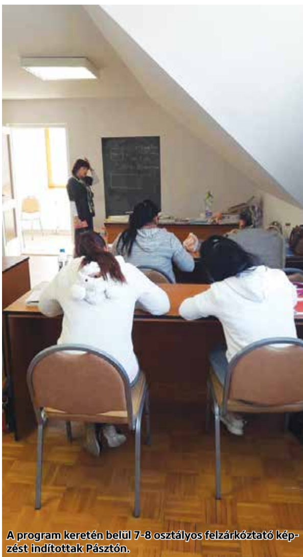
A program keretén belül 7-8 osztályos felzárkóztató képzést indítottak Pásztón.