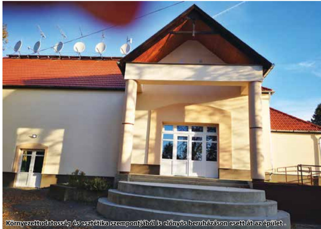
Környezettudatosság és esztétika szempontjából is előnyös beruházáson esett át az épület.

Cered Község Önkormányzata pályázatot nyújtott be a Terület- és Településfejlesztési Operatív Program keretében a községi Faluház és Művelődési Ház épületének energetikai korszerűsítésére. A projekt célja az épület primerenergia igényének károsanyag-kibocsátásának csökkentése, energetikai jellemzőinek javítása, valamint megújuló energia alapú rendszer és költséghatékony megoldások alkalmazása volt.