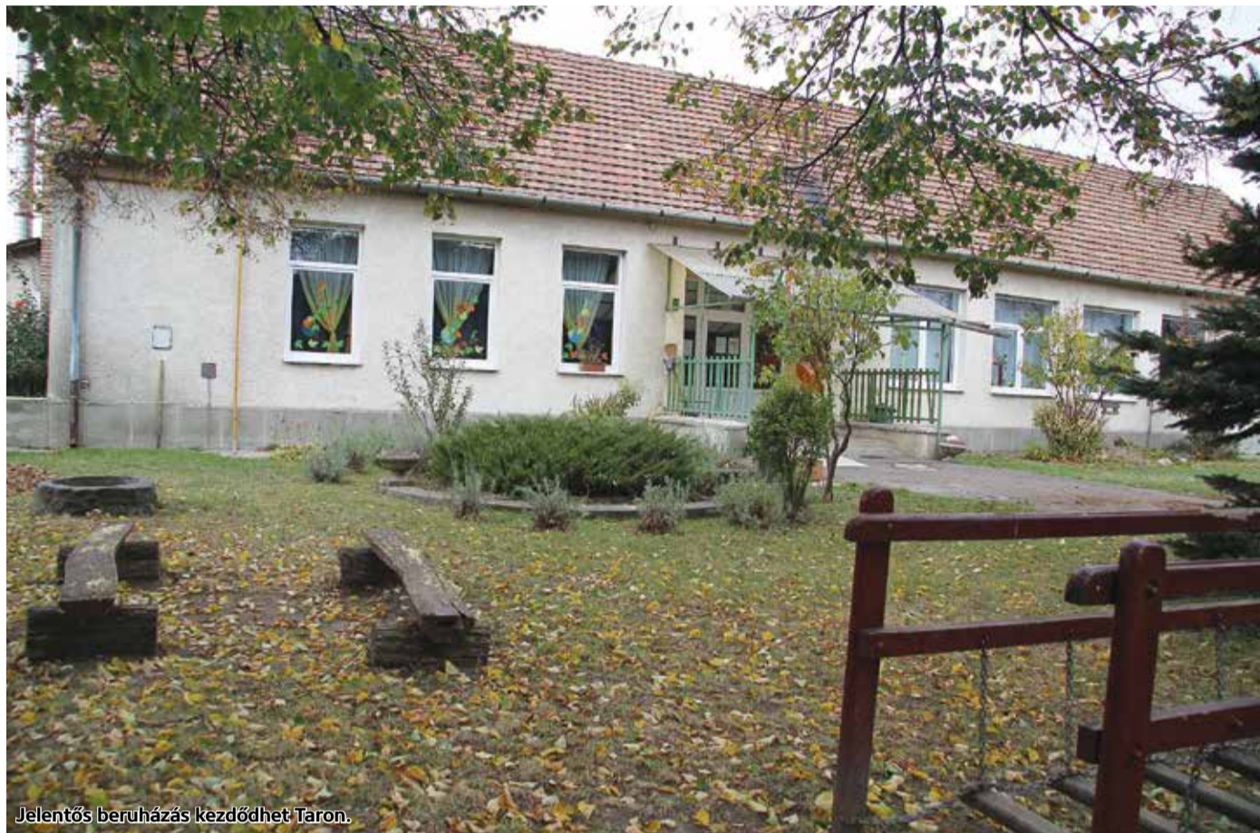
Jelentős beruházás kezdődhet Taron.

Tar község önkormányzata pályázatot nyújtott be a Terület- és Településfejlesztési Operatív Programhoz azért, hogy energetikai felújítást végeztesen el a község óvodáján. A projekt 25.992.990 forint támogatásban részesült a TOP-3.2.1-16-NG1-2017-00002 azonosító számú pályázat keretében.