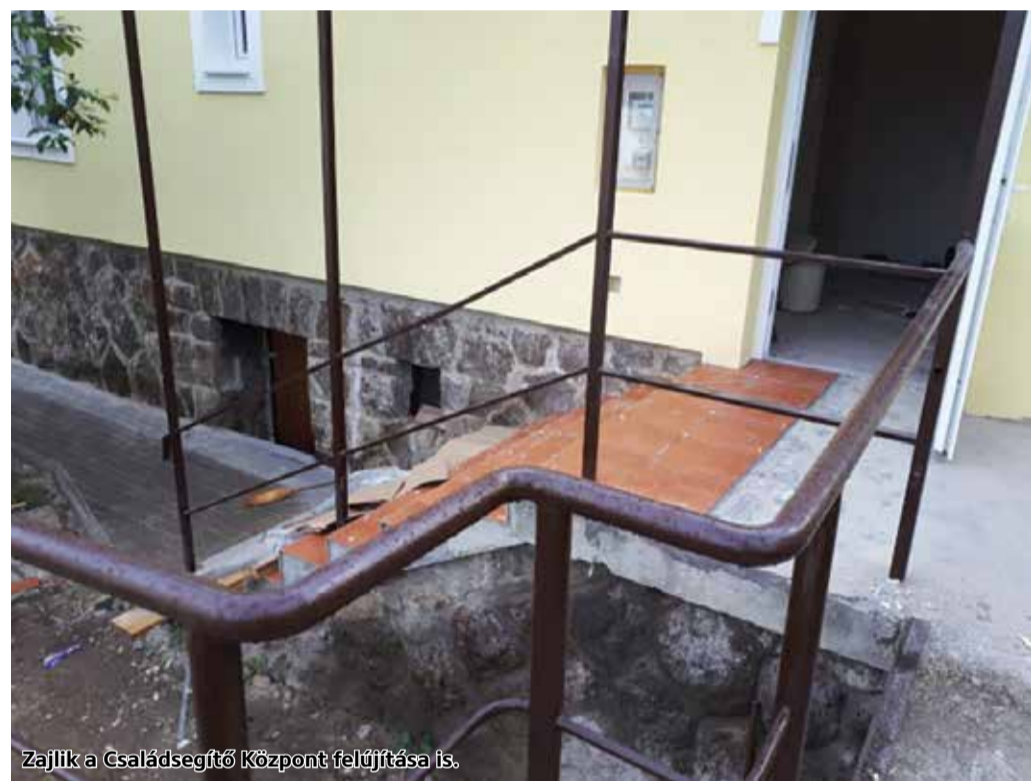
Zajlik a Családsegítő Központ felújítása is.