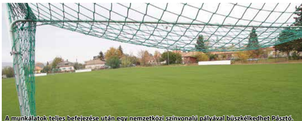
A munkálatok teljes befejezése után egy nemzetközi színvonalú pályával büszkélkedhet Pásztó.

A pásztói felnőtt focicsapat a megyei első osztályú bajnokságban kiválóan szerepel, s elindult az utánpótlás korosztály felkészítése is. A sportegyesület egészen mostanáig a mátraszőlősi pályán volt kénytelen játszani, mivel egy korábbi meg nem valósult fejlesztés során a városi sporttelep pályája alkalmatlanná vált mindenféle sportolásra. Idén az önkormányzat és az MLSZ TAO-támogatás igénybevételével egy minden igényt kielégítő, modern, öntöző-rendszerral ellátott pálya építését tűzte ki célul. A beruházás a végéhez közeledik. A Pásztó SE a tavaszi szezon már valóban hazai pályán, a Hajós Alfréd úti sporttelepen játszhatja. A pálya 71x111 méteres méretű. A munkálatok során teljes talajcsere történt, majd öntözőrendszert építettek be, ezután következett a gyepszőnyeg leterítése. Új kapuk és labdafogó hálók, valamint a futballhoz szükséges egyéb eszközök beszerzésére is sor kerül. A pálya körül egy futókör is épül. A pálya üzemeltetője a Pásztói Sport Klub Sportegyesület lesz, amely egy kisebb lelátóval járul hozzá a beruházáshoz – tudtuk meg.