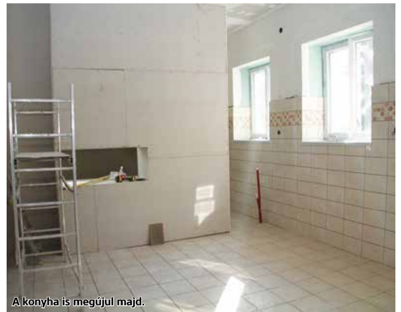
A konyha is megújul majd.