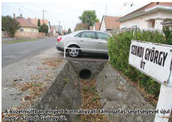
A közelmúltban elnyert kormányzati támogatás segítségével újul meg a Szondi György út.

Az elmúlt hetekben megvalósult Pásztón a Munkácsy és a Derkovits utak felújítása, a munkálatokat az önkormányzat fejlesztési hitelből finanszírozta. Ugyanezen csomag részeként újul meg a jövőben az Arany János és a Tücsök utca is a jövőben. Önerőből is dolgoztak Pásztó útjainak rendbe tételén, a Vezér út a nyár folyamán újult meg. Kormányzati támogatásból a Tóth Árpád út és a József Attila út kap új burkolatot, utóbbin jelenleg is zajlanak a munkálatok. A Cserhát lakónegyed útjára vonatkozó közbeszerzési eljárás elkezdődött – tudtuk meg a pásztói önkormányzat illetékes szakemberétől. Ahogy erről a közelmúltban beszámoltunk, további forrásbevonás történik a pásztói, önkormányzati tulajdonú utak rendbetételére, a város ugyanis a Belügyminisztérium pályázatán is nyert, így a Szondi György út is megújul, 273 méter hosszban. Itt a burkolatfelújítás mellett az ivóvíz nyomóvezeték kiváltása is megtörténik majd.