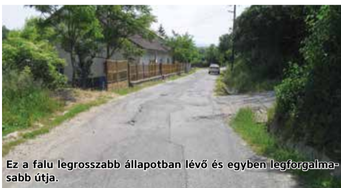
Ez a falu legrosszabb állapotban lévő és egyben legforgalmasabb útja.