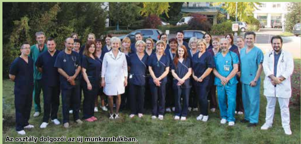
Az osztály dolgozói az új munkaruhákban.