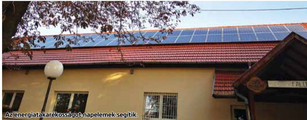
Az energiatakarékosságot napelemek segítik.

A fejlesztés megvalósításához az önkormányzat 80.000.000 Ft vissza nem térítendő támogatást nyert el 100%-os támogatási intenzitással a TOP-3.2.1-16-NG1-2017-00052 azonosító számú pályázat keretében. A kivitelezés befejeződött.