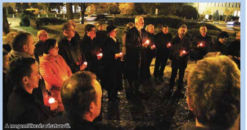
A megemlékezés résztvevői.

November 4-ét a kormány 2013-ban nyilvánította nemzeti gyásznapná.