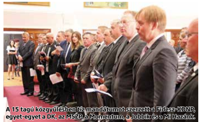
A 15 tagú közgyűlésben tíz mandátumot szerzett a Fidesz-KDNP, egyet-egyét a DK, az MSZP, a Momentum, a Jobbik és a Mi Hazánk.