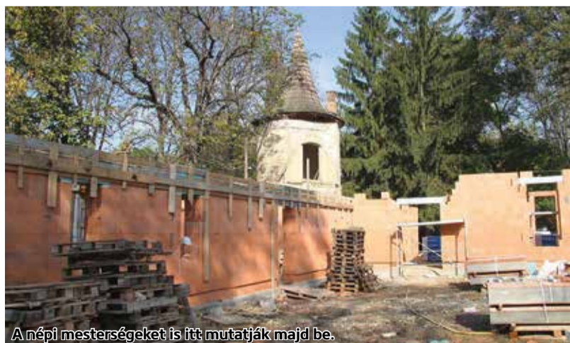
A népi mesterségeket is itt mutatják majd be.

A Palóc Porta kialakítása a jól halad Kisterenyén, a Gyűrky-Solymossy-kastély kertjében. A beruházás során – melyre Bátonyterenyé város önkormányzata a határon átvélt pályázat keretében (SKHU/1601/1.1/267.) nyert támogatást. – teljesen megújul a volt tisztiszolga lakás és a kupolás épület, interaktív udvar kerül kialakításra látványépítéssel, szolgáltatóházzal és itt mutatják majd be a népi mesterségeket is. A kézműves ház előreláthatólag jövő februárra fog elkészülni.