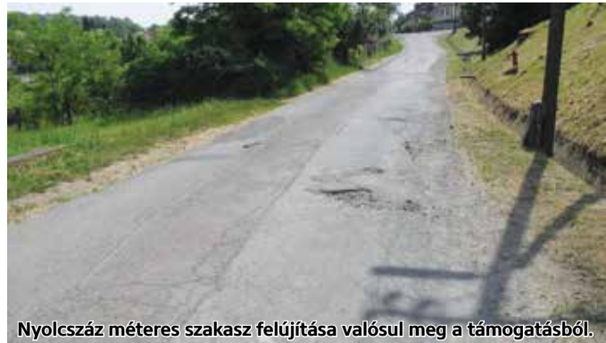
Nyolcszáz méteres szakasz felújítása valósul meg a támogatásból.