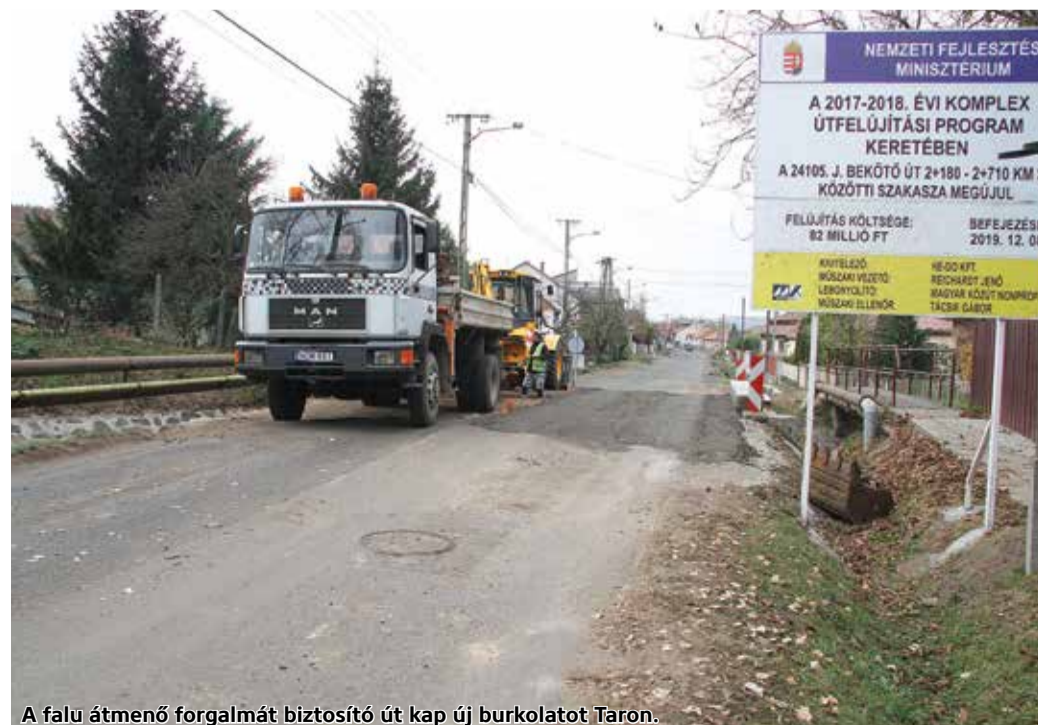
A falu átmenő forgalmát biztosító út kap új burkolatot Taron.

Útépités zajlik Taron, illetve a Tar és Pásztó közötti bekötő úton. A 24105 számú úton közel egy kilométeres szakasz felújítását valósítja meg a Magyar Közút, nyolcvankét millió forintból. A Nemzeti Fejlesztési Minisztérium 2017–2018 évi komplex útfelújítási programjában megvalósuló beruházás várhatóan év végére elkészül.