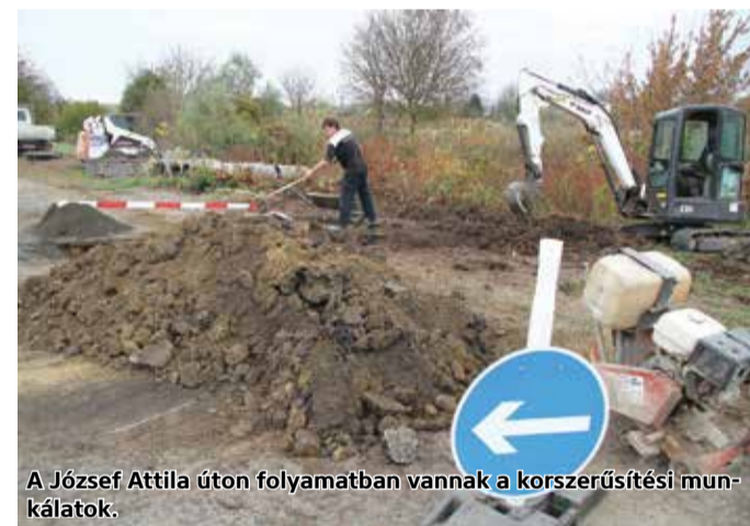
A József Attila úton folyamatban vannak a korszerűsítési munkálatok.

Az elmúlt hetekben megvalósult Pásztón a Munkácsy és a Derkovits utak felújítása, a munkálatokat az önkormányzat fejlesztési hitelből finanszírozta. Ugyanezen csomag részeként újul meg a jövőben az Arany János és a Tücsök utca is a jövőben. Önerőből is dolgoztak Pásztó útjainak rendbe tételén, a Vezér út a nyár folyamán újult meg. Kormányzati támogatásból a Tóth Árpád út és a József Attila út kap új burkolatot, utóbbin jelenleg is zajlanak a munkálatok. A Cserhát lakónegyed útjára vonatkozó közbeszerzési eljárás elkezdődött – tudtuk meg a pásztói önkormányzat illetékes szakemberétől. Ahogy erről a közelmúltban beszámoltunk, további forrásbevonás történik a pásztói, önkormányzati tulajdonú utak rendbetételére, a város ugyanis a Belügyminisztérium pályázatán is nyert, így a Szondi György út is megújul, 273 méter hosszban. Itt a burkolatfelújítás mellett az ivóvíz nyomóvezeték kiváltása is megtörténik majd.