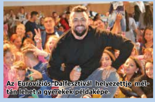
Az Eurovíziós Dalfesztivál helyezettje méltán lehet a gyerekek példaképe.

Az esemény már délelőtt elkezdődött, a program során színvonalas produkciót adott elő a helyi roma közösség, valamint a meghívott Kállói és Mátraverebélyi táncsoport. Ezt követően Pápai Joci, az Eurovíziós Dalfesztivál helyezettje lépett színpadra, aki méltán lehet a gyerekek példaképe. Őt követték a Aranyszemek, akik szintén fergeteges hangulatot „varázsoltak” a kultúrotthonba. Ez a nap alkalmat adott az ünneplésre és ismételten rávilágított arra, hogy a helyi roma közösségnek is jócskán van mire, illetve kikre büszkének lennie.