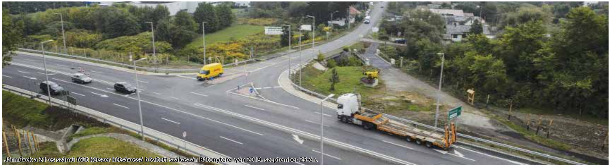
Járművek a 21-es számú főút kétszer kétsávosá bővített szakaszán Bátonyterenyén 2019. szeptember 25-én.

Átadták a 21-es főút két új Nógrád megyei szakaszát, ezzel az M3-as autópálya és Salgótarján között végig kétszer két sávon lehet közlekedni.