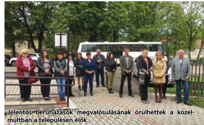
Jelentős beruházások megvalósulásának örülhettek a közelmúltban a településen élők.

Lucfalva önkormányzata a TOP-3.2.1-15-NG1 – Önkormányzati épületek energetikai korszerűsítése című pályázaton 43.218.001 forint támogatást nyert arra, hogy komplex korszerűsítést végezzen el a polgármesteri hivatalon. A kivitelezés során új nyílászárókat építettek be, hőszigetelték a homlokzatot és a tetőtér-beépítést határoló szerkezeteket. Napelemes rendszert telepítettek az épületre és korszerűsítették a fűtési valamint a villamossági rendszert is. A Terület- és Településfejlesztési Operatív Program támogatásával megvalósult beruházásokat májusban adták át ünnepélyes keretek között Becsó Zsolt és Dr. Becsó Károly országgyűlési képviselők, és Skuczai Nándor megyei közgyűlési elnök részvételével.