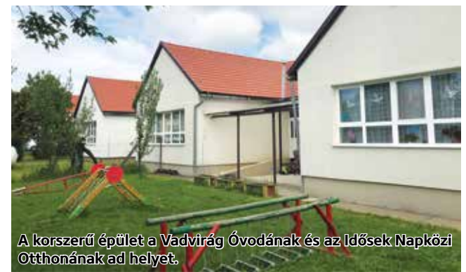
A korszerű épület a Vadvirág Óvodának és az Idősek Napközi Otthonának ad helyet.

A felújítást megelőzően az ingatlan energetikai szempontból szinte semmilyen tekintetben nem felelt meg a kor elvárásainak, annak korszerűsítése több szempontból is nagyon indokolt volt. Az önkormányzat az épületet a Terület- és Településfejlesztési Operatív Program keretében elnyert pályázatból, közel negyven millió forint támogatás felhasználásával újította fel. Jakab Gábor az avató eseményen ismertette: a felújítás során elvégezték többek között az épület külső homlokzatának, illetve a padlásfödémnek a hőszigetelését. A meglévő fűtési rendszert faelgázosító és elektromos kazánnal korszerűsítették, és napelemes rendszert is telepítettek. A polgármester hozzátette: emellett a palatető felszedésével megtörtént az azbesztmentesítés is. Ugyanakkor az akadálymentesítés érdekében rámpát építettek, illetve mozgáskorlátozottak használatára alkalmas mosdót alakítottak ki. Az átadó ünnepségen Becsó Zsolt országgyűlési képviselő, dr. Becsó Károly országgyűlési képviselő, és Skuczai Nándor, a Nógrád Megyei Közgyűlés elnöke is gratulált a beruházáshoz, és további sikeres építkezést kívántak a település lakóinak.