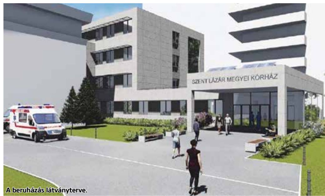
A beruházás látványterve.