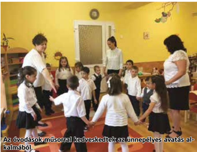
Az óvodások másorral kedveskedtek az ünnepélyes avatás alkalmából.