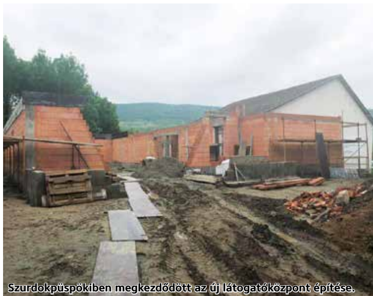
Szurdokpüspökiben megkezdődött az új látogatóközpont építése.

Elkezdődött a Mátra nyugati kapuja elnevezésű turisztikai projekt infrastrukturális fejlesztése. A munkálatok Szurdokpüspököt, Tart és Szuhá-Mátraalmást érintik. A közelmúltban Szurdokpüspökiben lerakták a fél milliárd forintos beruházás fő látványosságának, a pincesor közelében létesülő látogatóközpontnak az alapkövét.