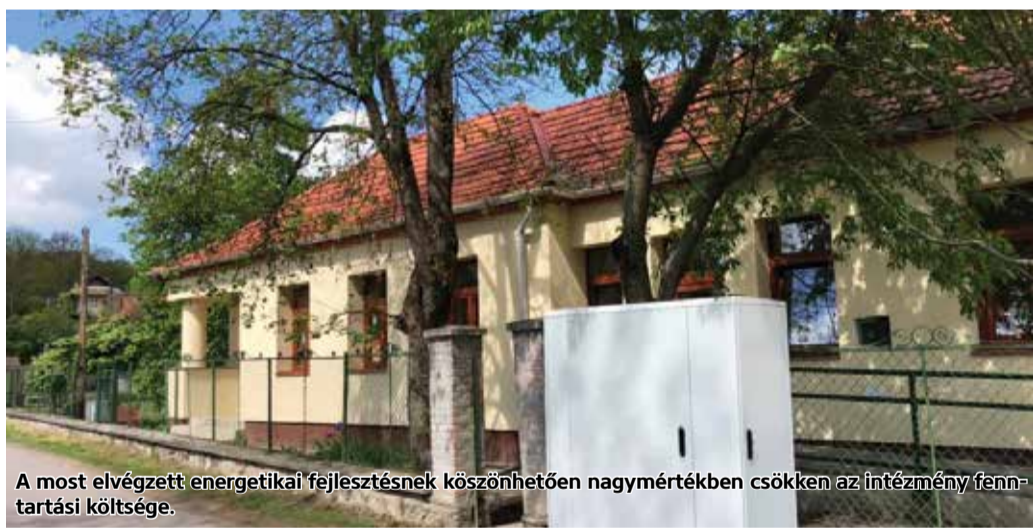
A most elvégzett energetikai fejlesztésnek köszönhetően nagymértékben csökken az intézmény fenntartási költsége.

Megújult Sámsonházán az óvodának, a könyvtárnak és a szociális irodának helyet adó épület – közölte Becsó Zsolt országgyűlési képviselő a közösségi oldalán. A közel 26 millió forintos beruházást a Terület és Településfejlesztési Operatív Program támogatta. Az 1960-ban épült létesítmény közel 170 négyzetméter alapterületű, kisebb felújításon 2012-ben már átesett. A most elvégzett energetikai korszerűsítés során szigetelést kapott a homlokzat, a padlásfödémre üvegyapot hőszigetelő rendszer készült. A nyílászárókat is tovább korszerűsítették és a kazán helyére kondenzációs gázkazán került, a fűtési rendszert automatikával programozható fűtésszabályozóval látták el. Az épületre napelemes rendszert is telepítettek, amellyel az elérhető primer energia megtakarítás 80%.