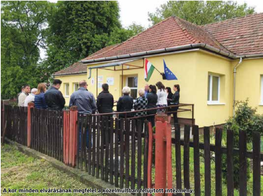
A kor minden elvárásának megfelel a közelmúltban felújított intézmény.

Átadták Cereden a korszerűsített óvoda épületét. A falu önkormányzata komplex energetikai felújítást valósított meg az ingatlanon a Terület- és Településfejlesztési Operatív Program 43 millió forintos vissza nem térítendő támogatásával.