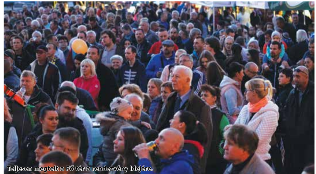
Teljesen megtelt a Fő tér a rendezvény idejére.

tívál, a Mátraterenyei Palacsinta Fesztivál, a Karancslapujtői Park Parti Fesztivál, a Pilinyi Grill Fesztivál, a Starján Feszt Fesztivál és a Forgács Kolbász Fesztivál csapatai készítettek a finom harapnivalókat, amelyeket néhány száz forintos támogatójegy vásárlásával lehetett megkóstolni, amik tombolaként is funkcionáltak, így értékes nyeremények is gazdára találtak. A színpadon egy különleges performanszot láthattak a látogatók. A Dűvő zenekar és a Nógrád Táncegyüttes közös előadásában több Kárpát-medencéhez köthető táncot és zenét vonultattak fel, ami megadta az esemény igazi fesztivál hangulatát. Ezt csak tovább fokozta Somogyi Kata opera és operett énekes produkciója.