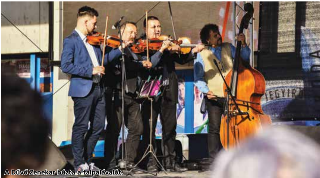
A Dűvő Zenekar húzta a talpalálót.

munkatársa. Kiemelte: ez a fesztivál egy eddig példátlan összefogás eredménye, hiszen a környékbeli civil szervezetek, cégek, közösségek együttes munkájának gyümölcseként jöhetett létre, az pedig külön egyedülálló, hogy a programot teljes mértékben adományokból finanszírozták. Hozzátette: a szórakozás mellett a segítségnyújtás is fontos volt, ezért az Ezerszín, Ezernyi Szív Egyesület együttműködésével 250 adag egytálélt osztottak szét a rászorulóknak között.