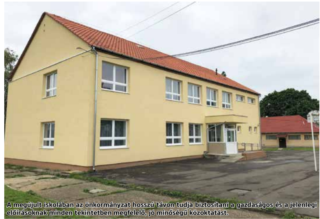
A megújult iskolában az önkormányzat hosszú távon tudja biztosítani a gazdaságos és a jelenlegi előírásoknak minden tekintetben megfelelő, jó minőségű közoktatást.

A Jobbágyi családsegítő szolgálat épületének energetikai korszerűsítése című projekt 24.834.596 forint, az orvosi rendelő pedig 18.549.131 forint támogatást kapott a fentivel megegyező pályázati kiíráson. Ebből a forrásból megvalósult a külső szigetelés, fotovillamos rendszer kialakítása és a fűtési rendszer korszerűsítése.