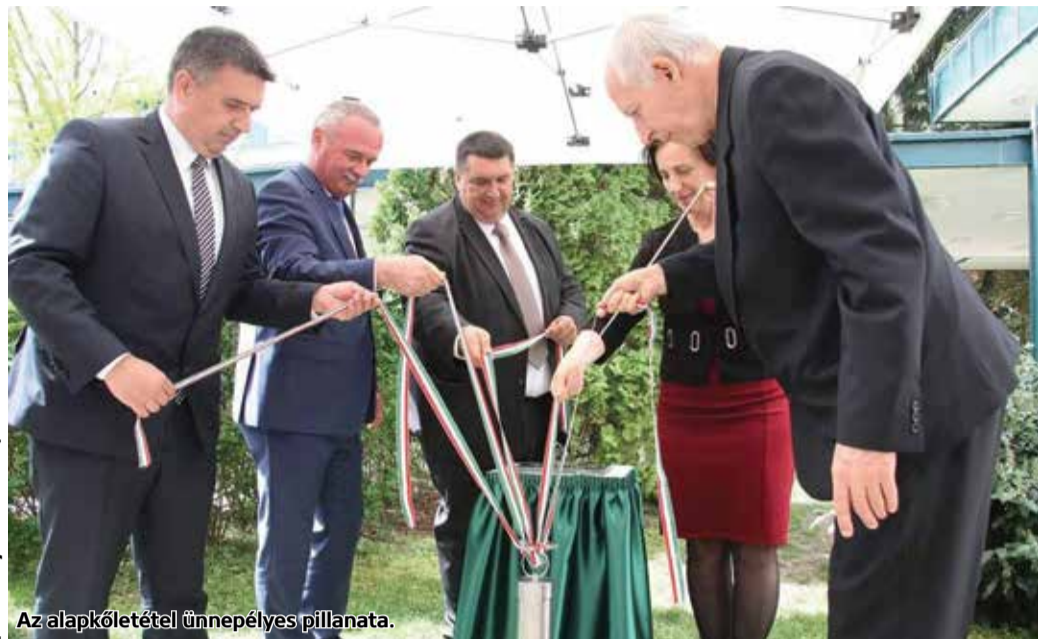
Az alapkövetétel ünnepélyes pillanata.

Új onkológiai központ épül Salgótarjánban, a Szent Lázár Megyei Kórházban; a beruházás 13 milliárd 380 millió forintból valósul meg 2020 végére, a Modern városok program keretében.