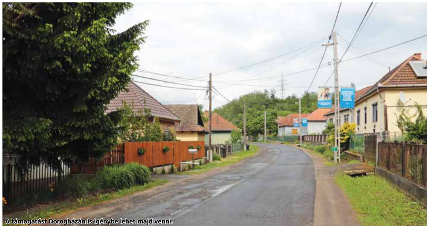
A támogatást Dorogházán is igénybe lehet majd venni.

Megjelent a falusi csok részleteit tartalmazó kormányrendelet a Magyar Közlönyben. Nógrád megyében 113 településen lehet majd igényelni a támogatást július 1. után.