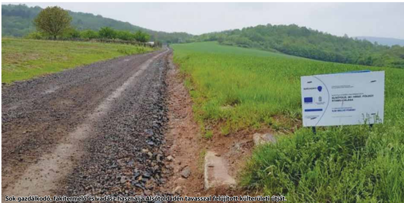
Sok gazdálkodó, fakitermelő és vadász használja Alsótold idén tavasszal felújított külterületi útját.