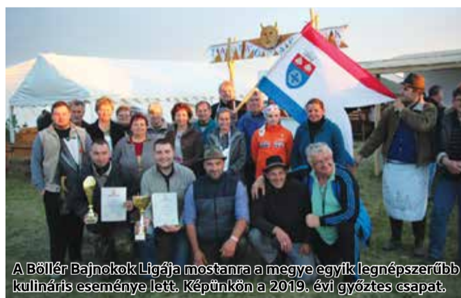
A Böllér Bajnokok Ligája mostanra a megye egyik legnépszerűbb kulináris eseménye lett. Képünkön a 2019. évi győztes csapat.

A településen évek óta nagy sikerrel rendezik meg a Böllér Bajnokok Ligáját, amely mostanra a megye egyik leg-