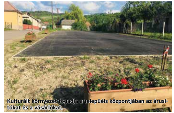
Kulturált környezet fogadja a település központjában az árusítókat és a vásárlókat.

hangsúlyozta: nagy öröm, hogy egyre több helyi termelő tevékenykedik a településen. A mátranovái piactéren rendszeres megjelenési lehetőséget fognak biztosítani nekik is, helyi termelői piac indításával, nyártól. A település vezetője egy másik fejlesztésről is nyilatkozott lapunknak. Hangsúlyozta: több mint hatvanötmillió forint európai uniós forrásból épülhetnek új járdák Mátranovákön. A fenntartható települési közlekedésfejlesztés konstrukción belül gyalogátkelőhelyek is létesülnek, valamint kerékpárút kijelölésére is sor kerül. – Főként az iskola és az óvoda környékén várhatóak az újítások, de a forgalmasabb, a gyárhoz közel eső útszakaszokon is tervezünk korszerűsítéseket – ismertette Mátranovák polgármestere.