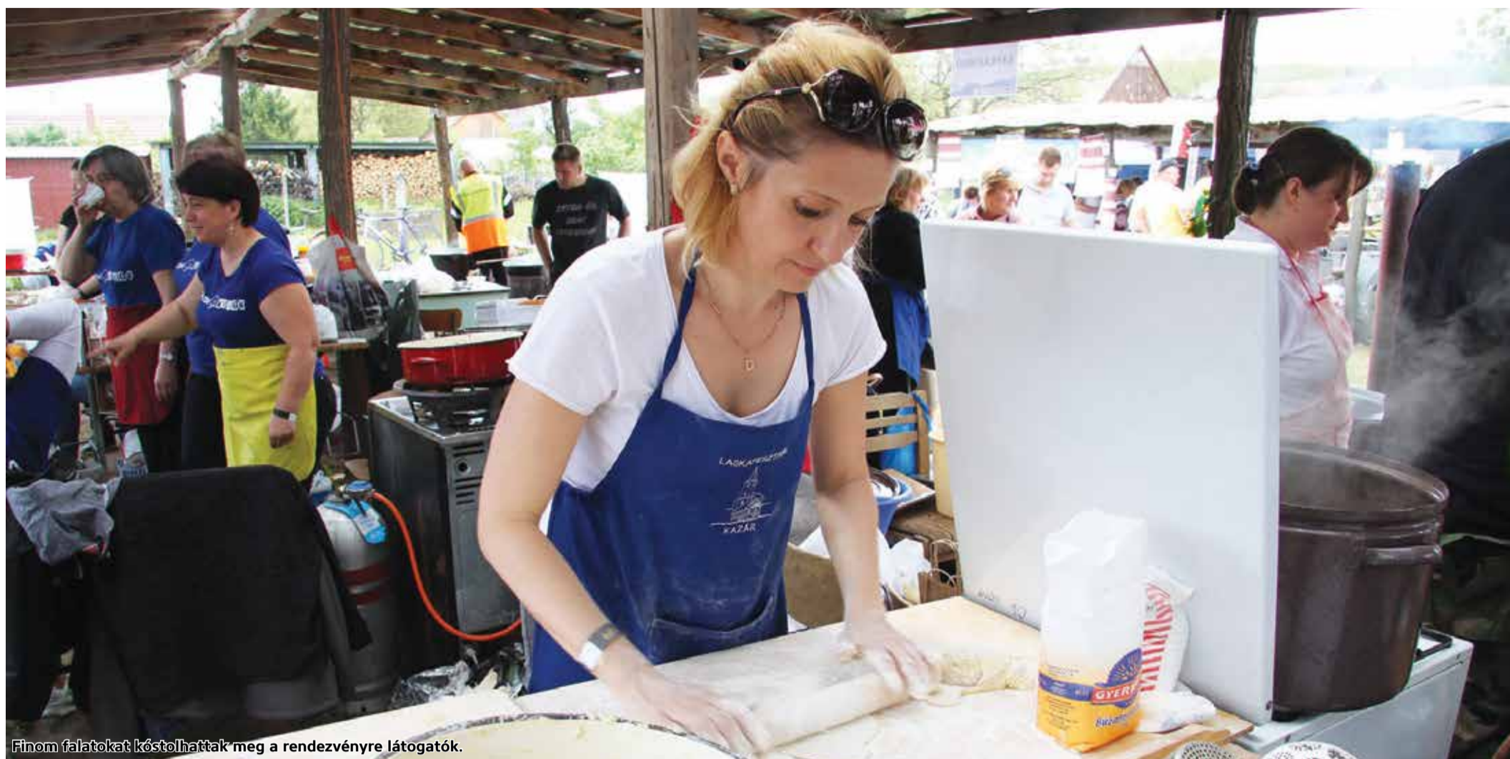
Finom falatokat kóstolhattak meg a rendezvényre látogatók.