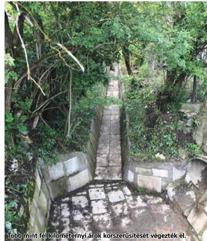
Több mint fél kilométernyi árok korszerűsítését végezték el.