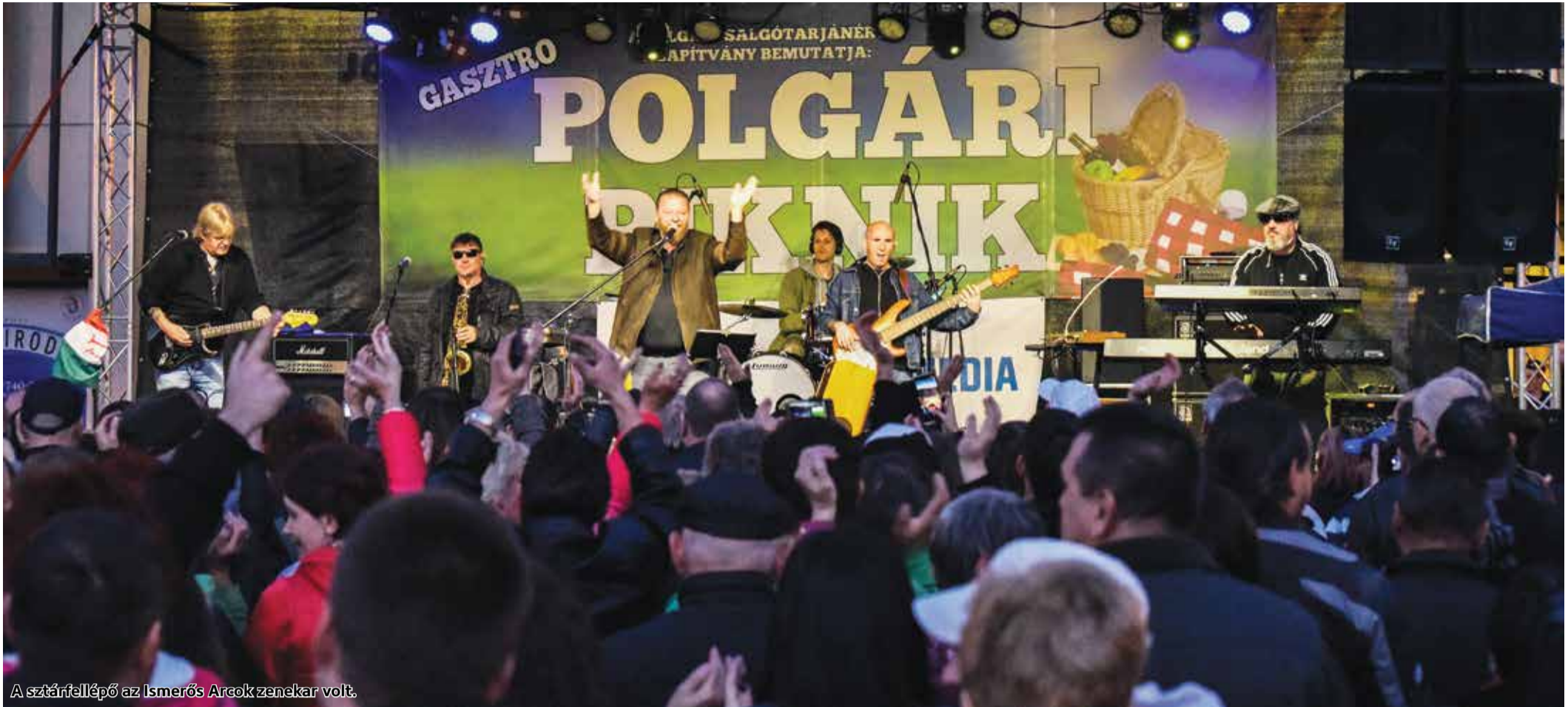
A sztárfellépő az Ismerős Arcok zenekar volt.

Hiánypótló eseményt tartottak május 10-án a megyeszékhelyen. A Concrete Média által kiemelten támogatott Gasztró Polgári Pikniken a környékbeli gasztronómiai fesztiválok csapatainak finom ételei mellett számos zenei program, kézműves sétány és vidámpark várta a látogatókat. A sztárfellépő az Ismerős Arcok zenekar volt.