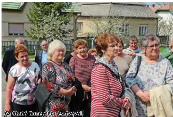
Az átadó ünnepség résztvevői.

Héhalomban a belvízrendezés keretében megvalósult a Szabadság domb szilárd burkolattal történő ellátása. A beruházást a közelmúltban adták át, ünnepélyes keretek között.