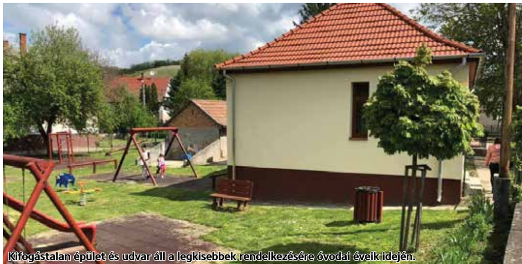
Kifogástalan épület és udvar áll a legkisebbek rendelkezésére óvodai éveik idején.

Megújult Sámsonházán az óvodának, a könyvtárnak és a szociális irodának helyet adó épület – közölte Becsó Zsolt országgyűlési képviselő a közösségi oldalán. A közel 26 millió forintos beruházást a Terület és Településfejlesztési Operatív Program támogatta. Az 1960-ban épült létesítmény közel 170 négyzetméter alapterületű, kisebb felújításon 2012-ben már átesett. A most elvégzett energetikai korszerűsítés során szigetelést kapott a homlokzat, a padlásfödémre üvegyapot hőszigetelő rendszer készült. A nyílászárókat is tovább korszerűsítették és a kazán helyére kondenzációs gázkazán került, a fűtési rendszert automatikával programozható fűtésszabályozóval látták el. Az épületre napelemes rendszert is telepítettek, amellyel az elérhető primer energia megtakarítás 80%.