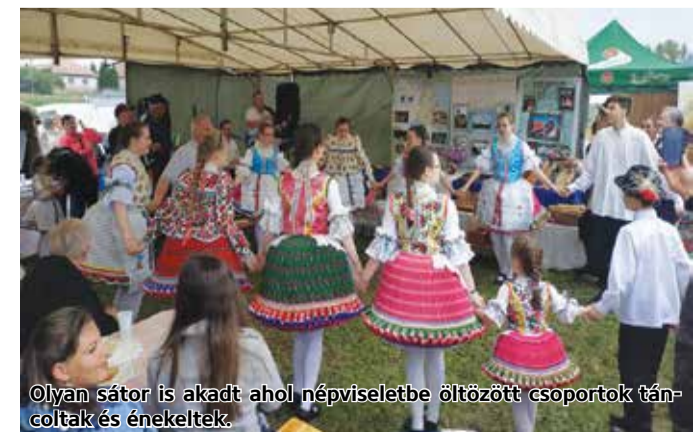
olyan sátor is akadt ahol népviseletbe öltözött csoportok táncoltak és énekeltek.

nyen 24 elismerő díjat, 8 különdíjat osztott ki a zsűri. A vándorszerleget ebben az évben a Tari Kocafogók nyerték meg. A több ezer látogató a finom disznótoros és különleges ételek kóstolása mellett színvonalas kulturális programokon is részt vehetett.