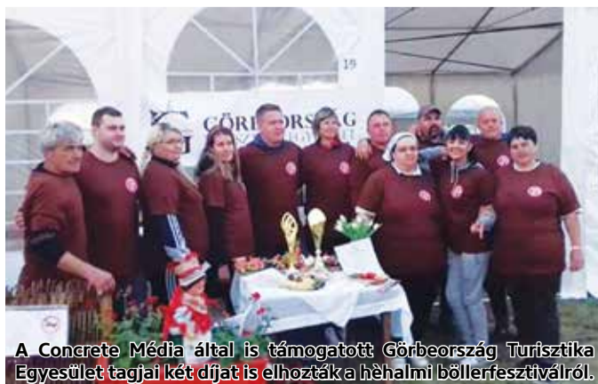
A Concrete Média által is támogatott Górzeország Turisztika Egyesület tagjai két díjat is elhozták a héhalmi böllérfesztiválról.

vonzóbb gasztronómiai eseménye lett. Idén április 27-én, immár ötödik alkalommal került megrendezésre, 24 csapat részvételével. A csapatok nagy részét a dél-nógrádi települések önkormányzatai képviselték, de részt vettek a versenyen Héhalom testvértelepülései is. A rendezvé-