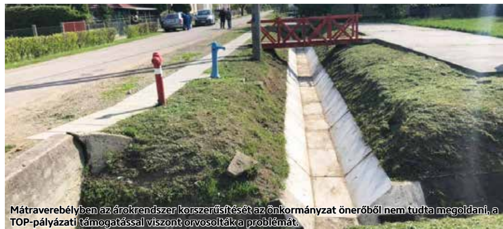
Mátraverebélyben az árokrendszer korszerűsítését az önkormányzat önerőből nem tudta megoldani, a TOP-pályázati támogatással viszont orvosolták a problémát.

A munkálatok során közel 80 köbméter földet mozgattak meg, 551 méter árokelemet építettek be, árokburkoló elemet 295 méteren raktak le, rézsűburkolás 90 m 2 -en történt. Emellett járdák helyreállítása valósult meg, valamint korlát helyreállítás és festés is. Közút melletti padkákat is felújítottak közúzalékból kapubehajtókra történő kifuttatással. Ezen túl tereprendezés és füvesítés is megvalósult a beruházásban, valamint ahol szükséges volt ott elvégezték a meglévő út alatti átvezetők tisztítását.