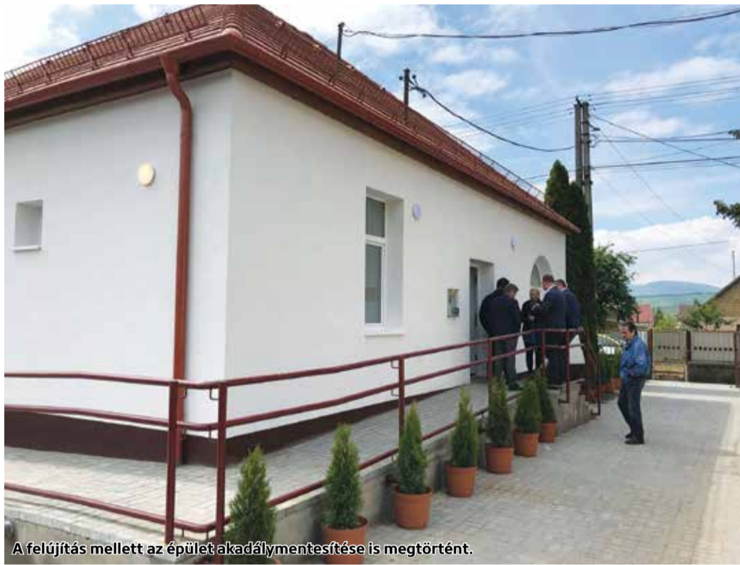
A felújítás mellett az épület akadálymentesítése is megtörtént.

Egy kihasználatlan önkormányzati ingatlan újult meg és kapott funkciót Taron. A település a Család- és Gyermekejélési Szolgálatot valamint a Házi Segítségnyújtást is befogadó intézménnyel gazdagodott a közelmúltban befejeződött fejlesztés megvalósulásával.