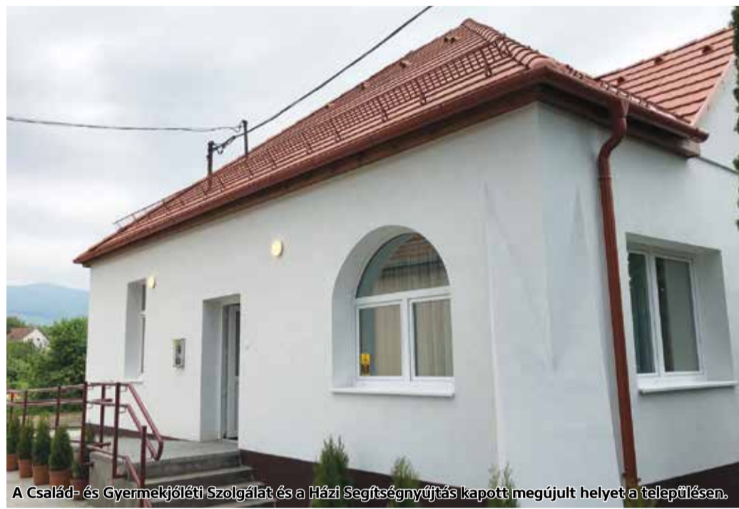
A Család- és Gyermekejélési Szolgálat és a Házi Segítségnyújtás kapott megújult helyet a településen.

Ehhez alkalmas helyet alakítottak ki a most történt beruházásban: a korábbi polgármesteri hivatal épülete, részleges átalakítása és teljes mértékű felújítása valósult meg. Megtörtént az épület akadálymentesítése, elkészült az épület tetőcseréje, a homlokzati és belső nyílászárók, a fal és padló burkolatok cseréje. Megvalósult az utólagos homlokzati és padlószigetelés. Felújították a teljes belső elektromos és épületgépészeti rendszert. Az épület mellett egy akadálymentes parkolót is kialakítottak. A szociális alapszolgáltatások biztosításához eszközök, bútorok és felszerelési tárgyak beszerzésére is sor került. A projekt eredményeként javul a szolgáltatások színvonala, hatékonysága.