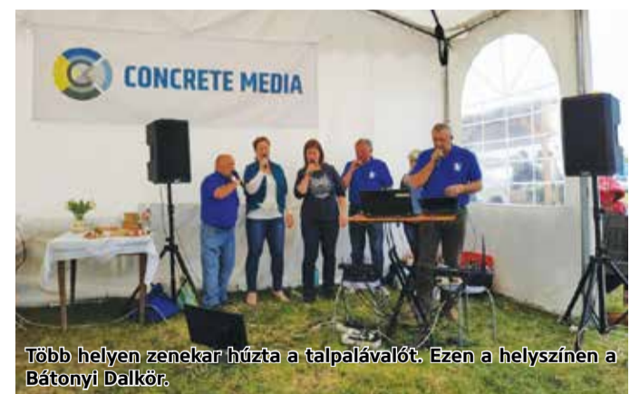
Több helyen zenekar húzta a talpalávalót. Ezen a helyszínen a Bányai Dalkör.

nyen 24 elismerő díjat, 8 különdíjat osztott ki a zsűri. A vándorszerleget ebben az évben a Tari Kocafogók nyerték meg. A több ezer látogató a finom disznótoros és különleges ételek kóstolása mellett színvonalas kulturális programokon is részt vehetett.