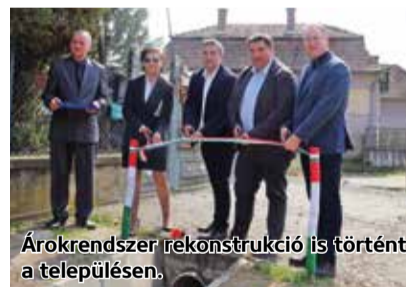
Árokrendszer rekonstrukció is történt a településen.

Sóshartyánban a tudatos építkezésnek köszönhetően a közelmúltban megújult az általános iskola épülete, fejlesztették a bölcsődét, bővítették a csapadékvíz-elvezetést és emlékhelyet állítottak az I. világháború sóshartyáni áldozatai, hősei előtti tisztelgésre. Mindezek mellett a Petőfi út is megújult. Ezen beruházások zömét a tavasz folyamán adták át a településen. Ezzel kapcsolatban Becsó Zsolt országgyűlési képviselő közösségi oldalán elmondta: – Sóshartyán szépen fejlődik, az elmúlt időszakban mindig is élt a lehetőségekkel.