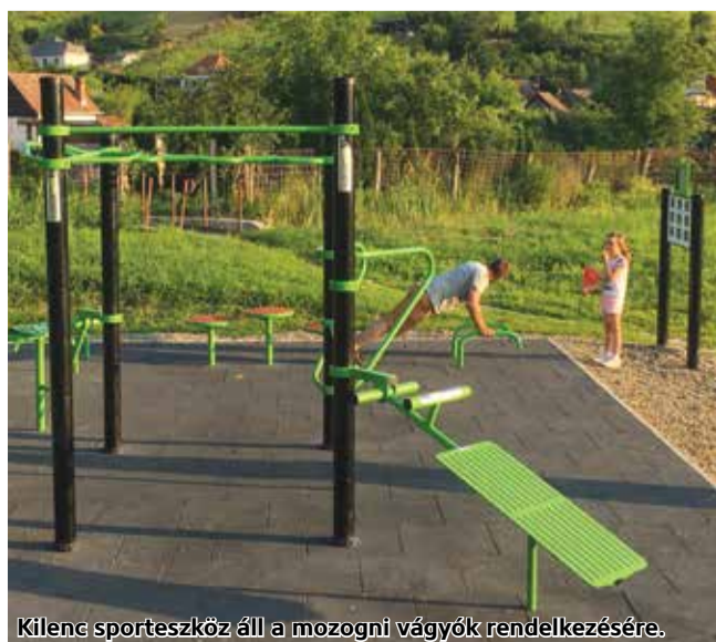
Kilenc sporteszköz áll a mozogni vágyók rendelkezésére.

A sportparkban tolózkodásra, húzózkodásra, has és hátizom erősítő, valamint fekvőtámasz gyakorlatokra alkalmas eszközöket helyeztek el, szám szerint kilencet. A kondipark 100 százalékos állami támogatásból épült meg a Nemzeti Szabadidős – Egészség Sportpark Programból. A sportparkokra három éve nyújthatják be pályázataikat az önkormányzatok. A lehetőségnek az a célja, hogy olyan közösségi tereket alakítsanak ki, ahol valamennyi korosztály, a fiatalabbaktól az idősebbekig aktívan töltheti el a szabadidejét igényes, ingyenesen használható szabadterei létesítményekben.