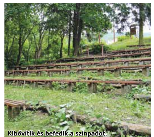
Kibővítik és befedik a színpadot.

kerékpár- és segway-tárolót is kialakítanak, de terveztek a projektbe frizbi golfpályát, buborékfocit és lézerharc-terepet is. Taron tematikus bemutatóhely létesül Tar Lőrinc ügynevezett „pokoljárásának” megismertetésére és turisztikai fogadóközpontot is építenek. Szuha-Mátraalmáson megújul a Községi Ház, melyben öltözőket, és előadótermet alakítanak ki, sőt egy kívülről nyílni mosdó is létrejön majd a projekt keretében. Ezen felül kibővítik és be is fedik az ott található színpadot, illetve játszótér is kialakításra kerül a pályázat keretében.