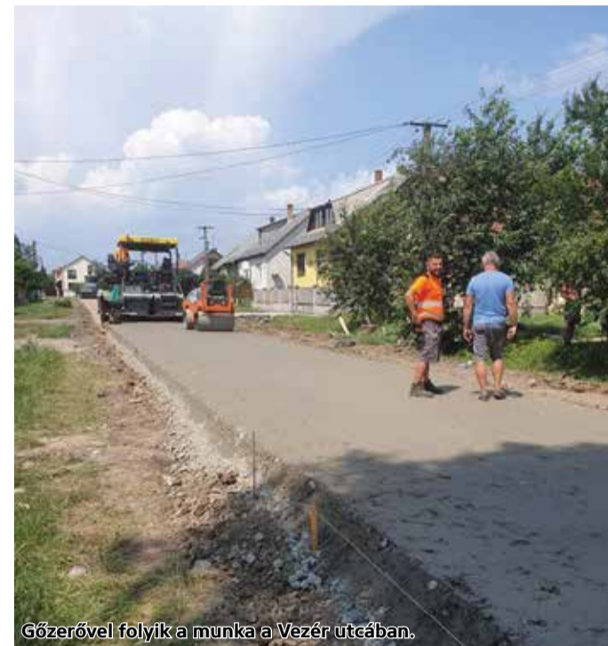
Gőzerővel folyik a munka a Vezér utcában.

Farkas Attila örömmel számolt be arról, hogy a Madách utca korszerűsítése június elején már el is készült, a beruházást pályázati összegből, jelentős önerő biztosítása mellett valósította meg az önkormányzat.