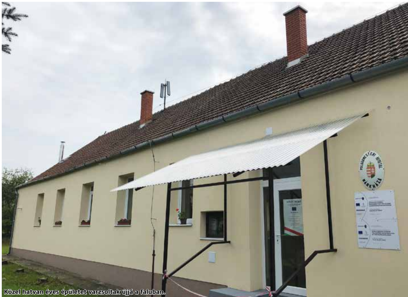
Közel hatvan éves épületet varzoltak újjá a faluban.