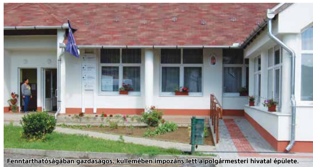
Fenntarthatóságában gazdaságos, küllemében impozáns lett a polgármesteri hivatal épülete.

A fejlesztés során elvégezték az utólagos külső oldali hőszigeteléseket a szükséges bontásokkal, helyreállításokkal és rendszer-kiegészítőkkel együtt. Leszigetelték a padlásfödémeket is és megtörtént a fűtésrendszer teljes korszerűsítése. Az épületben található korszerűtlen gázkonvektorokat elbontották, központi fűtési rendszert építettek ki kondenzációs gázkazánnal, automatikával programozható fűtésszabályozással ellátva, valamint a teljesítmény és a hőigény pontatlansága miatti veszteségek csökkentése érdekében termosztatikus radiátorszelepek beszerelésével. Az épület villamos energia fogyasztásának csökkentése érdekében hálózatra visszatápláló napelemes rendszert is telepítettek az épületre. A megvalósított projekt illeszkedik a Nemzeti Energiastratégia 2030-ban, Magyarország II. Nemzeti Energiahatékonysági Cselekvési Tervében, illetve a Nemzeti Épületenergetikai Stratégiában megfogalmazottakhoz. A beruházás hozzájárul az önkormányzatok által működtetett intézmények üvegház hatású gázok kibocsátásának csökkentéséhez.