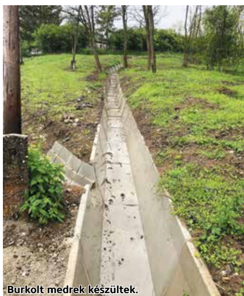
Burkolt medrek készültek.