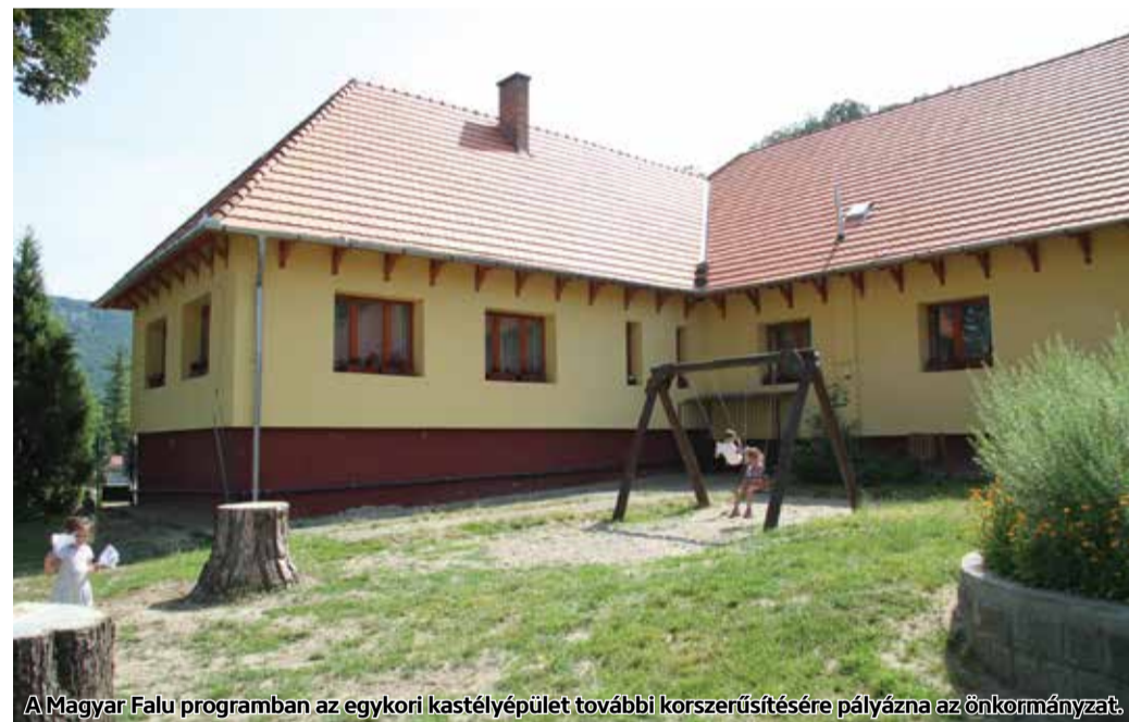
A Magyar Falu programban az egykori kastélyépület további korszerűsítésére pályázna az önkormányzat.

Huszoney és fél millió forintból korszerűsítették a somoskőújfalu Gesztenyekert Óvoda épületét. A beruházás ünnepélyes átadását májusban tartották.