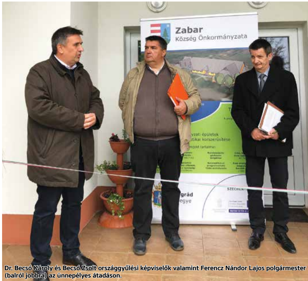
Dr. Becsó Károly és Becsó Zsolt országgyűlési képviselők valamint Ferencz Nándor Lajos polgármester (balról jobbra) az ünnepélyes átadáson.

A meteorológiai jelentésekből híres település egy gyönyörűen felújított épülettel gazdagodott a közelmúltban. Zabar Község Önkormányzata sikeresen pályázott a TOP-3.2.1-15-NG1 – Önkormányzati épületek energetikai korszerűsítése című kiírásra és nyert 58.698.651 forintot a helyi Községháza korszerűsítésére. A beruházás elkészült, májusban adták át.