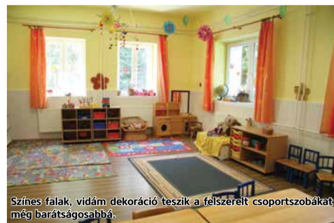
Színes falak, vidám dekoráció teszik a felszerelt csoportszobákat még barátságosabbá.

Skuczai Nándor, a Nógrád Megyei Önkormányzat Közgyűlésének elnöke és Becső Zsolt országgyűlési képviselő. A vendégek megköszönték az óvodások színvonalas műsorát és sok örömet, boldog gyermekéveket kívántak az intézmény minden kis növendékének, majd kiemelték, hogy a jövőben is azon fognak dolgozni, hogy Kelet-Nógrád élhető térség legyen a családok számára.