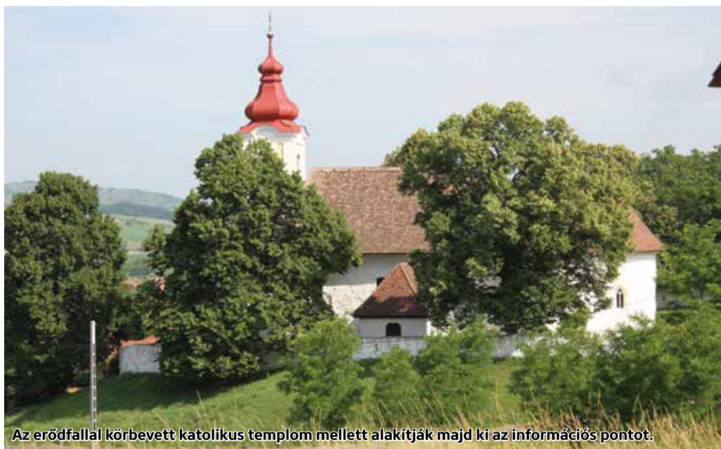
Az erődfallal körbevett katolikus templom mellett alakítják majd ki az információs pontot.

Megkezdődtek a munkálatok Tar turisztikai fejlesztése kapcsán. Két új létesítményt hoznak létre: egy turisztikai információs pontot és a falu egykori szülöttjének, a pokoljárásáról ismert földesurának, Tar Lőrincnek állítanak emléket.