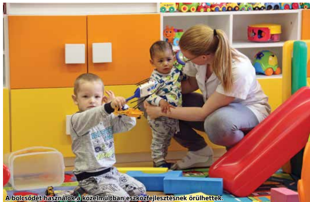
A bölcsődét használók a közelmúltban eszközfejlesztésnek örülhettek.