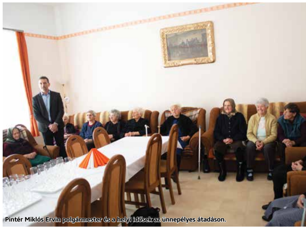
Pintér Miklós Ervin polgármester és a helyi idősek az ünnepélyes átadáson.

A fejlesztést az Önkormányzat a TOP-4.2.1-15-NG1-2016-00015 azonosító számú pályázaton nyert 75.090.327 Ft támogatásból valósította meg.