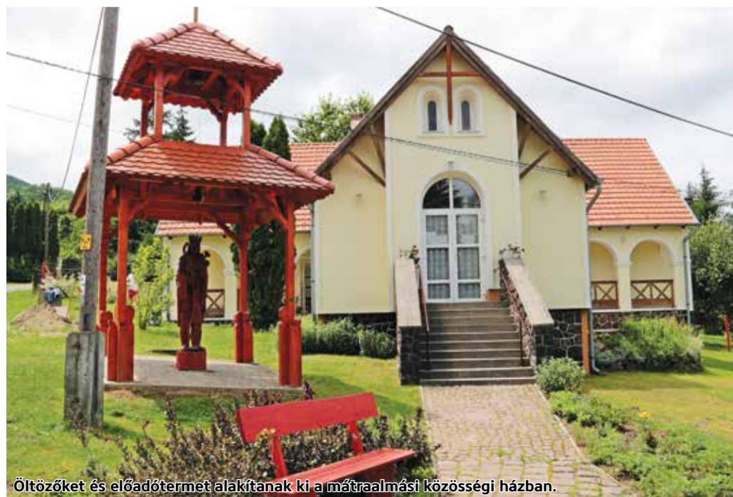
Öltözőket és előadótermet alakítanak ki a mátraalmási közösségi házban.

Szurdokpüspökiben, Taron és Szuha-Mátraalmáson közel félmilliárd forint pályázati támogatással valósul meg a Mátra Nyugati Kapuja turisztikai projekt. Utóbbi településen megújul a Községi Ház, kibővül a közelében található színpad, illetve játszótér is kialakításra kerül.