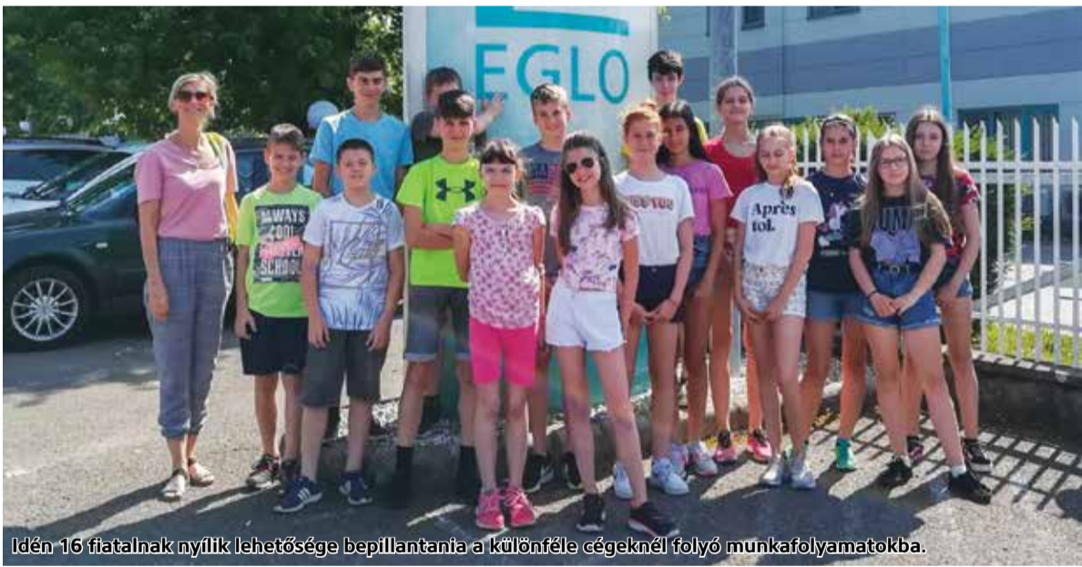
Idén 16 fiatalnak nyílik lehetősége bepillantania a különféle cégeknél folyó munkafolyamatokba.

A Nógrád Megyei Kereskedelmi és Iparkamara (NKIK) prioritásként kezeli a fiatalok pályaaorientációjának támogatását. A szervezet minden tanévben osztályfőnöki órák tucatjain, információs napok szervezésével, pályaválasztási börszékhez kapcsolódva, illetve újabban a „Szakmavilág” road show nógrádi állomásain törekszik arra, hogy az általános iskolások minél pontosabb és aktuálisabb képet kapjanak a szakmaválasztás kérdésköréről. Az NKIK a tanév végétével is tovább folytatja ezen tevékenységét: most 16 fiatal táborozik szervezésükben, akik öt nap alatt hat térségbeli cégnél ismerkednek meg különféle szakmákkal.