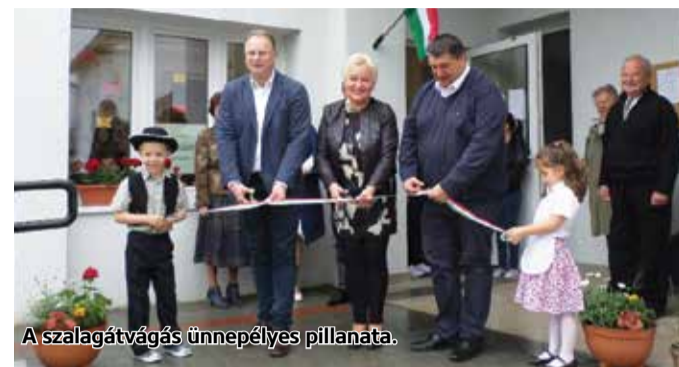
A szalagátvágás ünnepélyes pillanata.

és az üvegházhatású gázok kibocsátásának csökkentése az épület energiahatékonyságot célzó korszerűsítése által. Az energetikai fejlesztés az óvoda üzemeltetési, fenntartási költségeinek csökkenését eredményezi, és a fejlesztésnek köszönhetően az épület hőtechnikai adottságai javulnak, hővesztései csökkennek, a település pedig egy környezetbarát és gazdaságilag hatékonyabban üzemeltethető közintézménnyel rendelkezik. Az épület korszerűsítés utáni átadását május 15-én tartották. Az eseményen részt vett