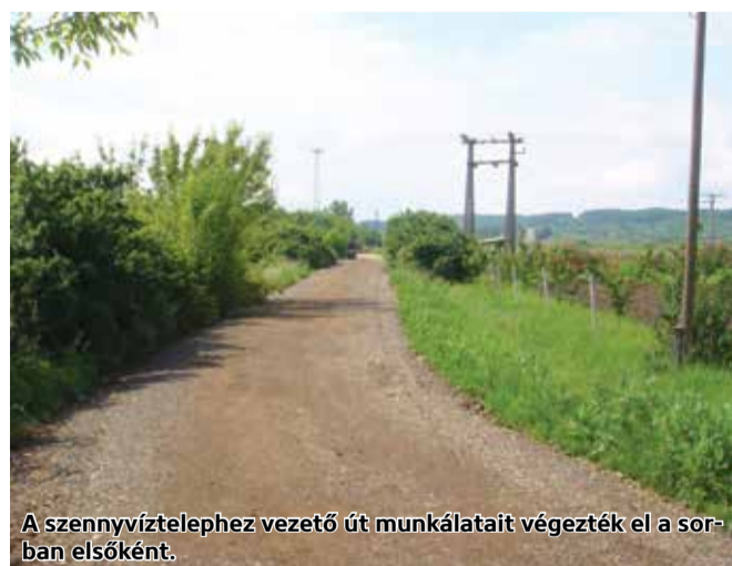
A szennyvíztelephez vezető út munkálatait végezték el a sorban elsőként.

Pásztó Város Önkormányzata a „Külterületi utak fejlesztése Pásztón” című, VP-7.2.1-7.4.1.2-16 azonosítási számú projektjének megvalósítására közel 78 Millió Forint áll rendelkezésére, amelyhez a város a vissza nem térítendő vidékfejlesztési támogatás mellett 10 százalék önerőt biztosít. A munkálatok már javában zajlanak.