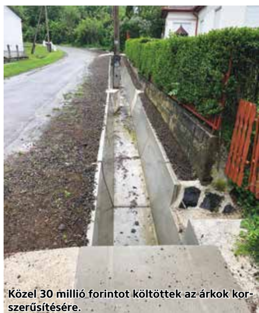
Közel 30 millió forintot költöttek az árok korszerűsítésére.

Átfogó cél volt a település belterületi csapadékvíz elvezetési rendszerének fejlesztése, környezetbiztonságának növelése, környezeti állapotának javítása, a helyi vízkár veszélyeztettség csökkentése, a további környezeti káresemények megelőzése. A pályázat fő céljai a következők voltak: a belterületre hullott csapadék megfelelő elvezetése, növénytelepítés, a vis maior védelme, a lakosság szemléletformálása az okozott vízkárok megelőzése érdekében. A veszélyeztetett vagy már sérült műtárgyak újraépítése, esetenként áttelepítése, és szükség esetén zárt vízvezető rendszerek kiépítése. Nem utolsó sorban pedig csapadékvíz-gazdálkodási létesítmények rekonstrukciója, fejlesztése: átteresztő burkolat alkalmazása, beszívárogató, szívárogató drén és szűrőmező létesítmények, zöld infrastruktúrák építése. A fejlesztéssel 420 méter árkot tettek rendbe.