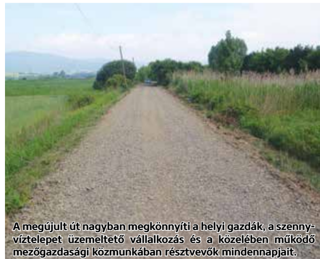
A megújult út nagyban megkönnyíti a helyi gazdák, a szennyvíztelepet üzemeltető vállalkozás és a közelében működő mezőgazdasági közmunkában résztvevők mindennapjait.

a Szennyvíztelep felé vezető út 931 méter hosszban, a Muzslai útról lecsatlakozó út 218 méter hosszban és a Nyikomra vezető út egy része 3661 méter hosszban. A mezőgazdasági utak felújítása megkezdődött, a Szennyvíztelep felé vezető út már elkészült, a munkálatok teljes befejezése év végéig várható. Az utakat 3-4 méter szélességben állítják helyre 20 cm vastagságú kőzsalék úttükörrel, árkokat, áttereszket alakítanak ki a felszíni vizek elvezetése érdekében, és ahol szükséges, ott megtörténik a cserjék irtása is.