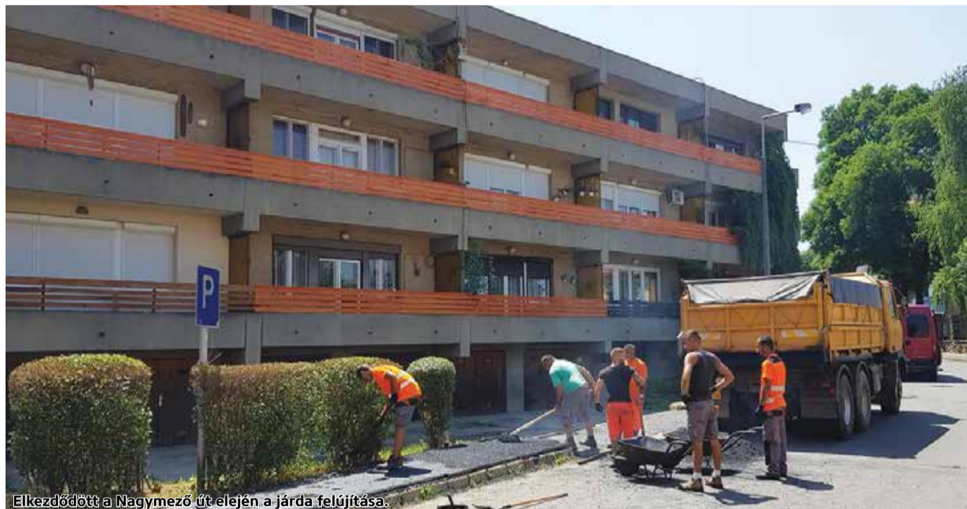
Elkezdődött a Nagymező út elején a járda felújítása.

Három különböző SUV, ugyanaz a célkitűzés!