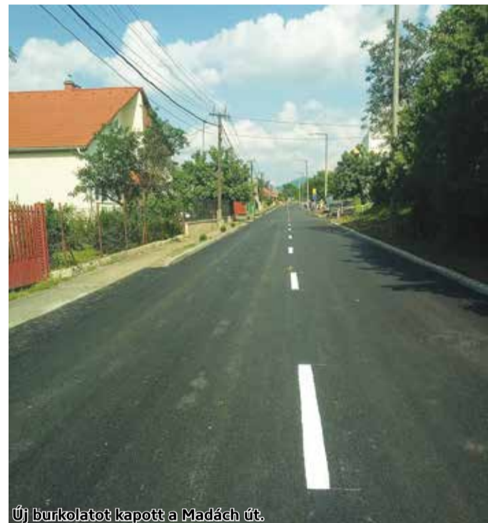
Új burkolatot kapott a Madách út.