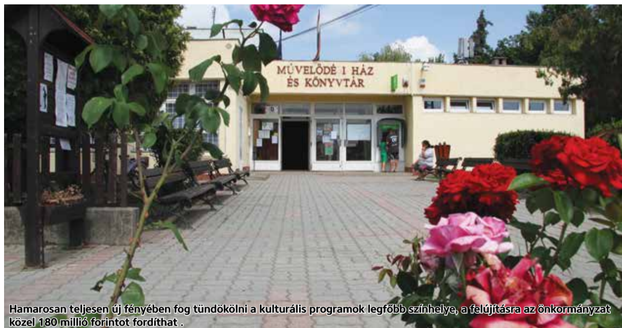
Hamarosan teljesen új fényében fog tündökölni a kulturális programok legfőbb színhelye, a felújításra az önkormányzat közel 180 millió forintot fordíthat.

Palotás Község Önkormányzata sikeres pályázatot nyújtott be a Terület- és Településfejlesztési Operatív Program keretében azzal a céllal, hogy csökkentse az önkormányzati tulajdonú Művelődési Ház épületének primer energiaigényét és károsanyag kibocsátását, valamint elősegítse hatékonyabb energiahasználatát és racionálisabb energiagazdálkodását, továbbá növelje az épület energiaellátásában alkalmazott megújuló energia részarányát.