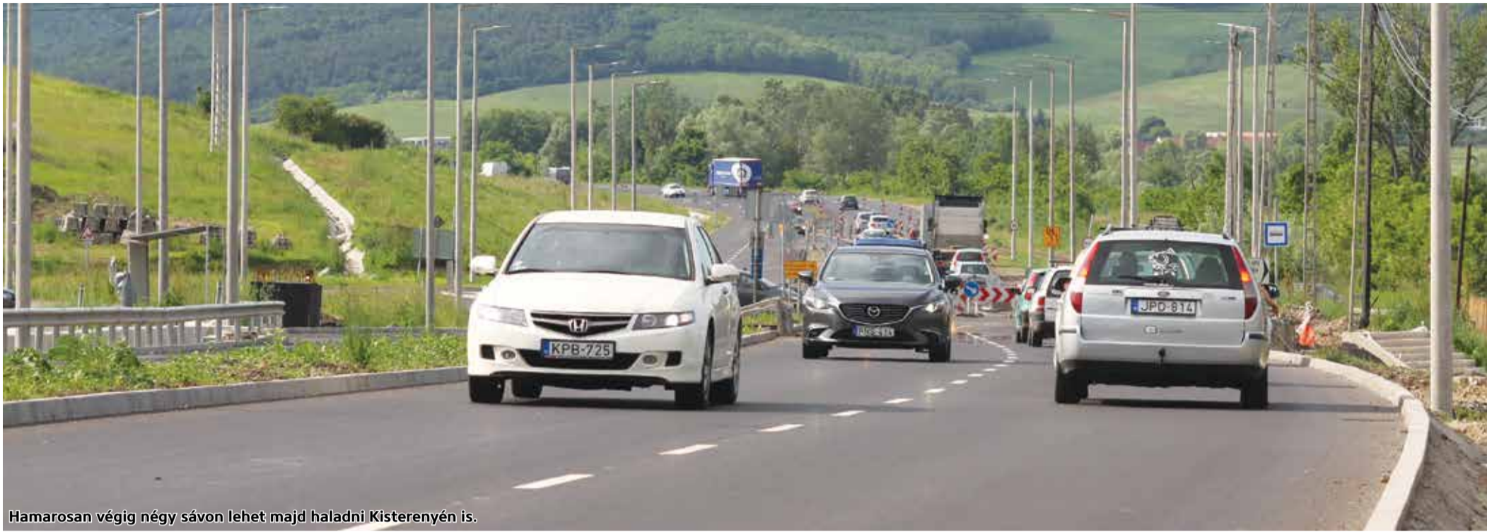
Hamarosan végig négy sávon lehet majd haladni Kisterenyén is.

A végéhez közeledik az M3-as autópályát Salgótarjánnal összekötő 21-es út négysávosítása. Az útvonal utolsó két hiányzó szakaszát egyaránt a Swietelsky Magyarország Kft., a HE-DO Kft. és a KM Építő Kft. kivitelezte. Mint megtudtuk még a nyár folyamán befejeződik majd a nagy volumenű beruházás.