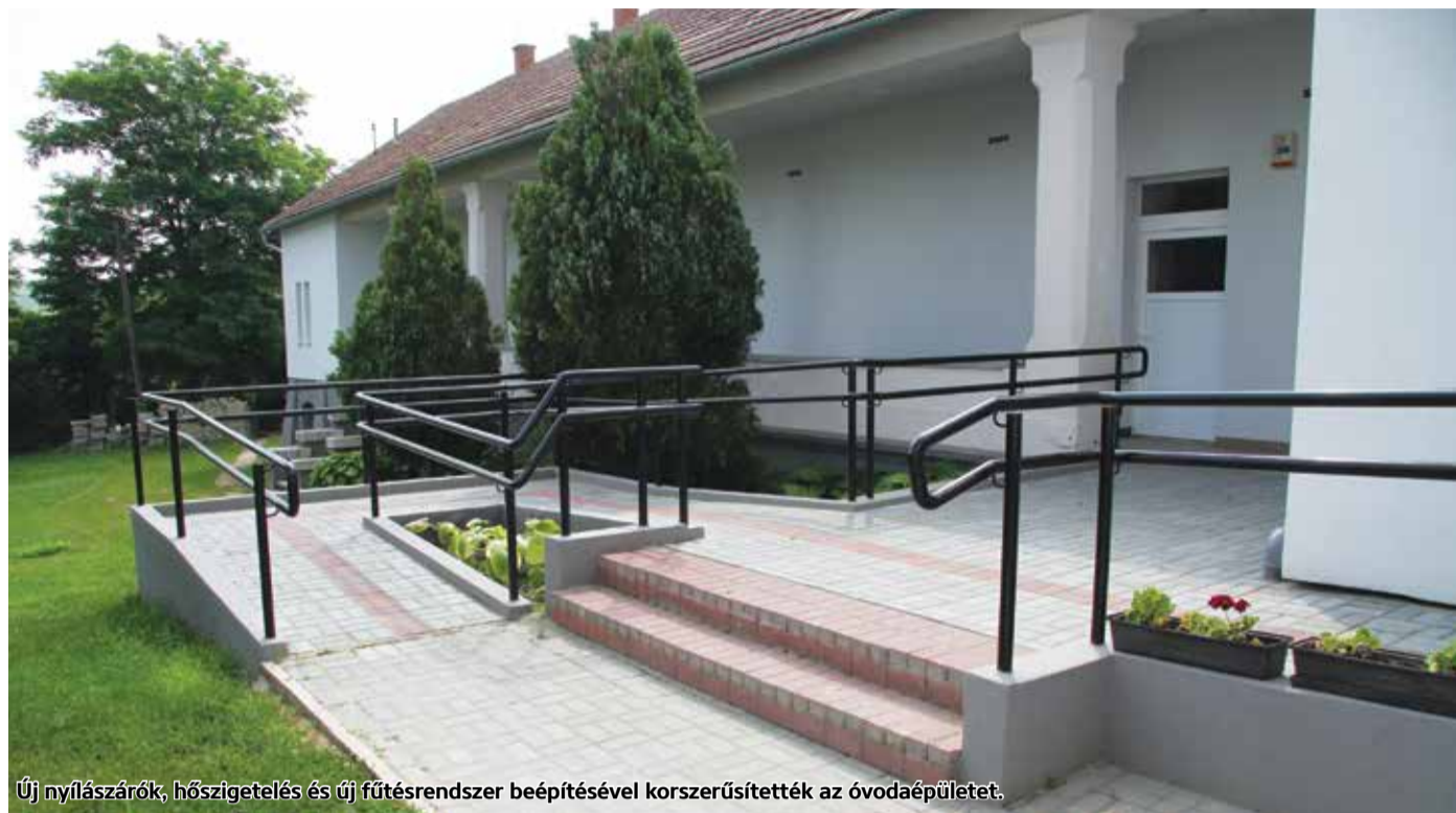
Új nyílászárók, hőszigetelés és új fűtési rendszer beépítésével korszerűsítették az óvodaépületet.

Kisbágyon Község Önkormányzata 34 millió forint támogatás felhasználásával valósította meg a „Kisbágyoni óvoda energetikai korszerűsítése” című projektet. A felújított épület ünnepélyes átadása májusban volt.