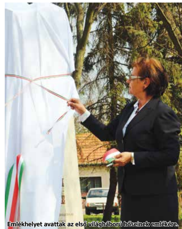
Emlékhelyet avattak az első világháború hőseinek emlékére.