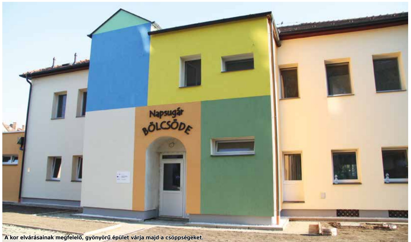
A kor elvárásainak megfelelő, gyönyörű épület várja majd a csöppsegeket.

Ahogy arról korábban beszámoltunk: kormányzati támogatással újul meg a Napsugár bölcsőde Bátonterenyén. A korszerűsítést mintegy 150 millió forintból végzik el, illetve ehhez még az önkormányzat is biztosít közel 30 millió forintot. A munkafolyamatok jelenleg is gőzerővel zajlanak, a csöppsegek előreláthatólag augusztus végén vehetik majd birokba a megszállt épületet.