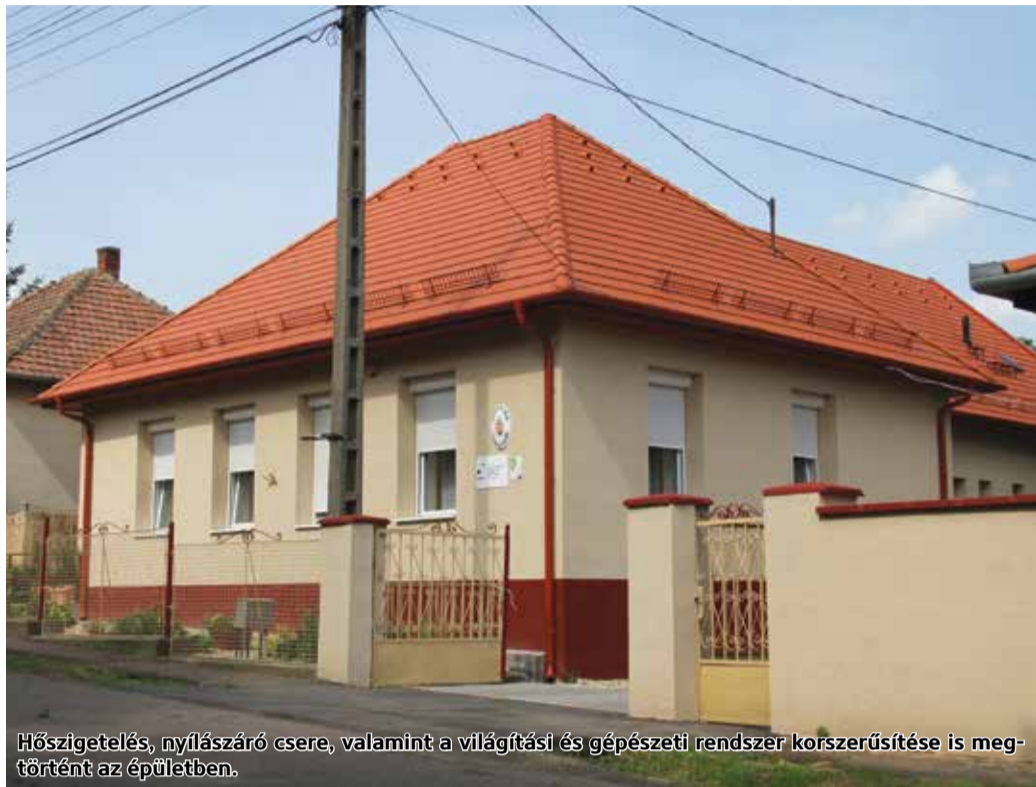
Hőszigetelés, nyílászáró csere, valamint a világítási és gépészeti rendszer korszerűsítése is megtörtént az épületben.

Szurdokpüspöki, mint a Jobbágyi-Szurdokpüspöki és Térsége Szociális Társulás tagja, a Jakabi Idősek és Demens Személyek Klubjában biztosítja az időskorúak nappali ellátását, illetve ugyanott Család- és Gyermejkölési Szolgálat is működik. Az intézménynek helyet adó épület 1930-ban épült, felújításra, átalakításra szorult. Szurdokpüspöki Község Önkormányzata pályázatot nyújtott be a Terület- és Településfejlesztési Operatív Program keretében azzal a céllal, hogy az igénybe vevők számára komfortosabbá tegye az intézményt és bővítse annak szolgáltatásait.